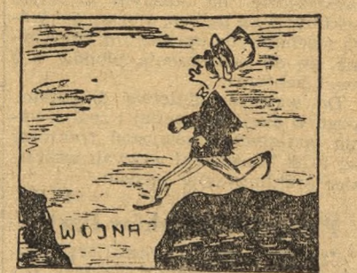
skok w dal