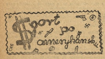
Rys. Zdzisław Olesiński

Jeżeli strona organizacyjna będzie należyte przygotowana, a obiekty i sprzęt w dobrym stanie, to należy oczekiwać, że sezon letni przyniesie sportowcom pomorskim wiele nowych sukcesów, które postawią nasz okręg w rzędzie czołowych w kraju. Pracy jest wiele, ale chętnych do tej pracy zwłaszcza w szeregach ZMP jest niemiernie. Trzeba ich tylko wyszukać, a następnie nimi odpowiednio pokierować. W K.