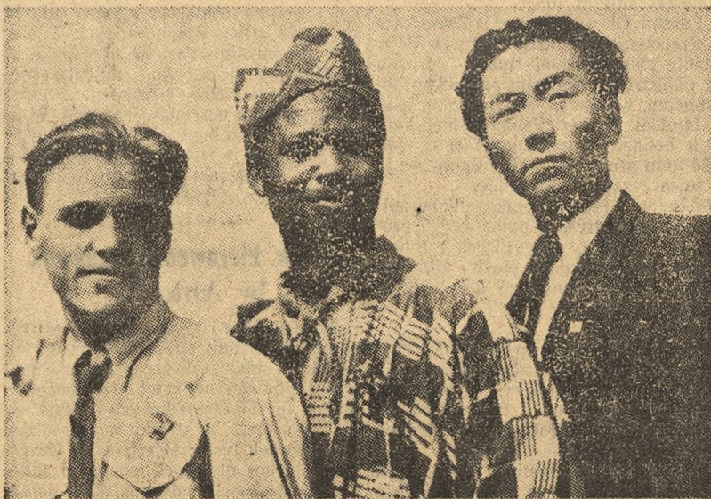
Przedstawiciel młodzieży węgierskiej, zachodnio-afrykańskiej i mongolskiej na III Światowym Zlocie Młodych Bojowników o Pokój w Berlinie.