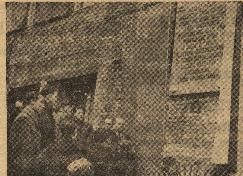
W Poznaniu odsłonięto pamiątkową tablicę ku czci działaczy PPR poległych w walce z okupantem. Tablica umiurwana jest na jednej z ścian domu, który był w okresie okupacji siedzibą gestapo.

Np. w gminie Osiecin jest dobra ziemia. Wszyscy rolnicy mają dobrze zaprowadzone gospodarstwa i wszyscy