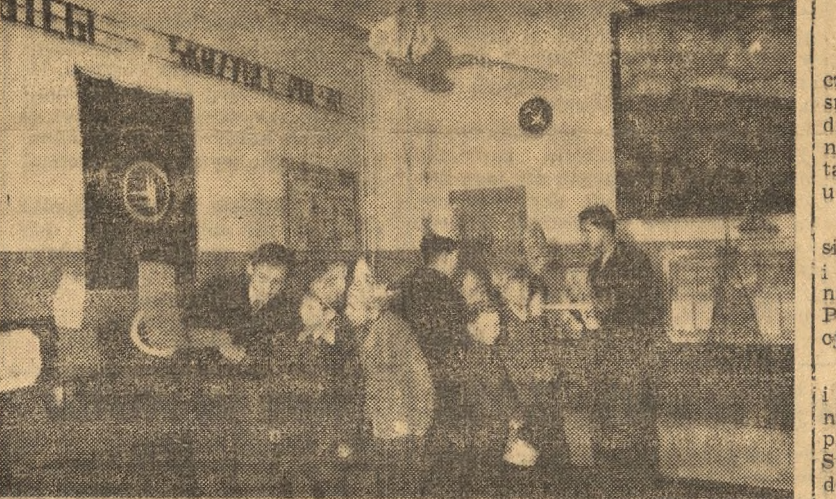
Towarzystwa Przyjaźni Dzieci zorganizowało w Bydgoszczy wielką imprezę noworoczną, w której w ciągu 3 dni wzięło udział 6000 zwłastwo szkolnej. NA ZDJĘCIU: Grupa dzieci ogląda eksponaty w salce wystawowej Kola Lata Lotniczej w gmachu Szkoły TPD.