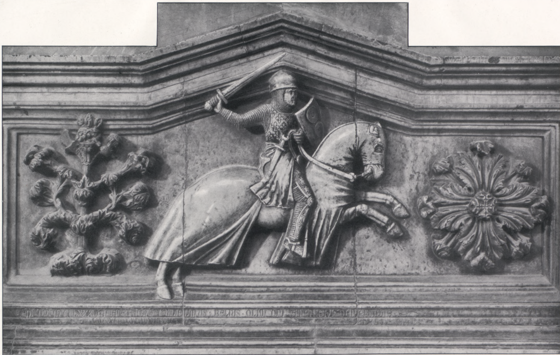
Grabstein des Wilhelm Berardi, + 1289.