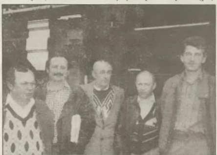
Sawo '94 - strażacy z OSP Dąbrowa przed nowoczesnym samochodem gaśniczym - Jelcz 240 R6

W środę 21 września br. sześciu strażaków z Ochotniczej Straży Pożarnej w Dąbrowie zwiedziło odbywającą się w Bydgoszczy wystawę pod nazwą Sawo '94, na której pokazano nowoczesny sprzęt do ratownictwa pożarowego, drogowego, wodnego oraz BHP. Było co zwiedzać. Gdyby jeszcze mieć go w remizie to i ratownictwo wyglądałoby inaczej. O takim sprzęcie można niestety tylko pomarzyć. (pd)