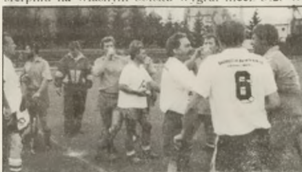
Mecz Oldboyów z drużyną niemiecką

kontakty z reprezentacją z Poznania, z którą w sierpniu na własnym boisku wygrał mecz 3:2. W