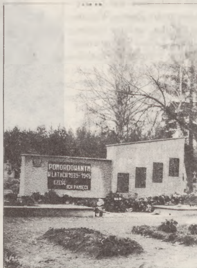
Cmentarz w Sipiorach; pomnik postawiony w 1975 r. na miejscu zbiorowej mogiły 80 zamordowanych przez hitlerowców mieszkańców Sipior i okolicy w czasie II wojny światowej.