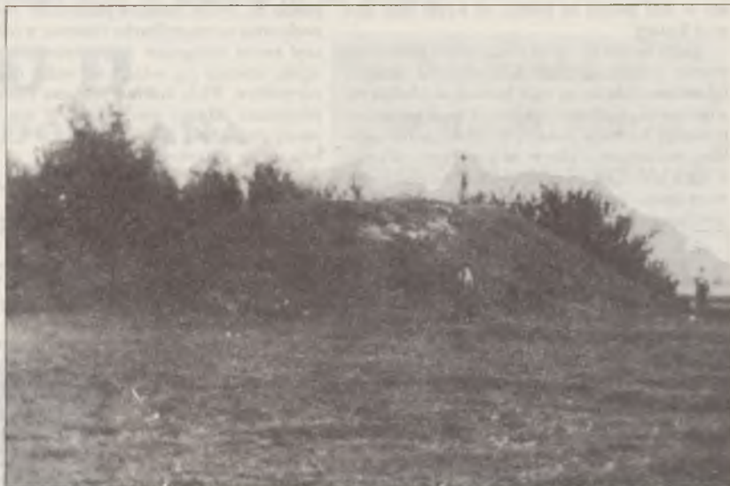
Łekno - grodzisko kasztelańskie z XIII w.