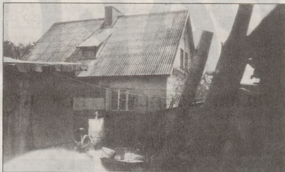
Domek w Żłotnikach z oknem, do którego strzelano. Zdjęcie zrobione z miejsca, w którym stał strzelający.