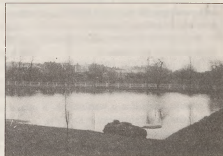
Próbne napętnienie basenu w Żninie.

W rezultacie w Żninie powstanie basen odkryty, pierwsze prace zostały już poczynione (patrz zdjęcie). Mamy nadzieję, że do końca przyszłego roku ta - jakże cenna dla naszego miasta inwestycja - zostanie ukończona. DOMINIK KSIĘSKI