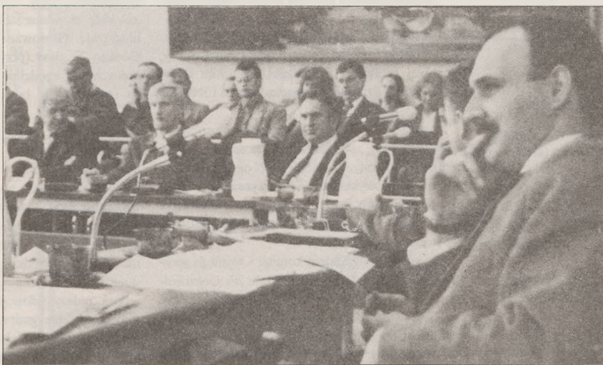
Radni i zaproszeni goście na sesji

Różne dochody (w tym odsetki za nieterminowe wpłaty podatków oraz usługi na rzecz Agencji Rolnej Własności Skarbu Państwa) wyniosły o 314.041 tys. zł. więcej niż przewidywano.