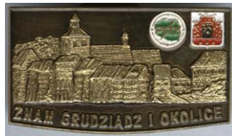
Znam Grudziądz i okolice.

Prosta odznaka 3 stopniowa, ja posiadam stopień brązowy. Można ją zdobyć w 1 dzień, należy zwiedzić 3 obiekty twierdzy według regulaminu. Weryfikuje oddział PTTK Chełmno.