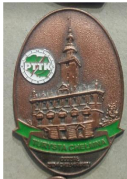
Odznaka turysta Chelмна

Uprawiam geocaching musiałem mieć ją w swojej kolekcji. Geocaching to szukanie skrytek po GPS. Stopień popularny za 100 skrytek, stopień brązowy za 250 skrytek.