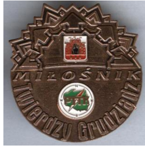
Miłośnik twierdzy Grudziądz.

Otrzyma się tę odznakę za zwiedzenie cytadeli, udział w 2 wycieczkach po twierdzy, zwiedzenie 5 obiektów twierdzy. Weryfikuje oddział PTTK Grudziądz.