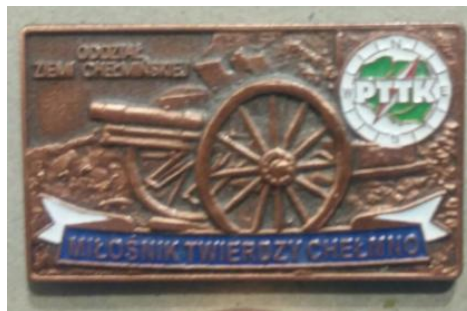
Miłośnik twierdzy Chełmno.

Otrzyma się tę odznakę za zwiedzenie cytadeli, udział w 2 wycieczkach po twierdzy, zwiedzenie 5 obiektów twierdzy. Weryfikuje oddział PTTK Grudziądz.