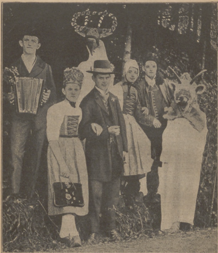
Abb. 2. Das Sprägeln.

der mannigfachsten Weise geübt. Kinder gehen zu ihren Paten und Großeltern und bekommen für ihre Glückwünsche einen Neujahrswedden oder einen Brotring oder sonst Geschenke. Auch ziehen noch hier und dort arme Leute oder Kinder herum und singen das neue Jahr an und erwarten dafür eine Gabe.