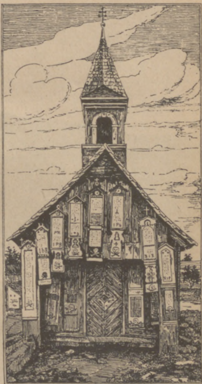
Abb. 28. Kapelle mit Totenbrettern.

Steht der Tod eines Menschen nahe bevor, so soll man die Fenster öffnen oder einen Ziegel im Dach losmachen, damit die Seele einen Ausweg findet. Das Sterben wird dem Menschen dadurch erleichtert, und die Angehörigen erleiden durch Zusammensein mit seiner