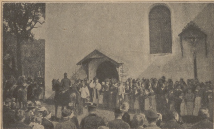
Abb. 16. Georgtritt aus Oberbayern.

Felder, um das Gras auszuläuten. „Wohin die Grasausläuter kommen, da wächst das Gras gut, und das Getreide bringt reiche Frucht“, sagt dort der Bauer und bewirtet deshalb zum Dank die Knaben.