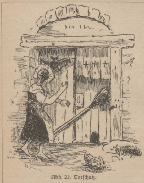
Abb. 22. Torſchutz.

Die Kraftübertragung wird oft durch Berühren hervorgerufen, oder der segenbringende Gegenstand wird gegessen oder der Kranke wird durch irgendwelche Zaubermittel in ursächlichen Zusammenhang mit segenbringenden Vorgängen oder Gegenständen gebracht. Gegen „Rotlauf“ nimmt man in Bayern die drei ersten Zweiglein von Holunderblüten, siedet sie ab und trinkt den Saft; gegen Sieber kaut man das erste Veilchen oder die drei ersten Kornähren, die man findet. Kinder