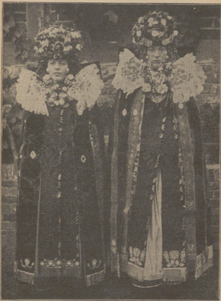
Abb. 25. Braut und Brautjungfer aus niederländischem Gebiet.