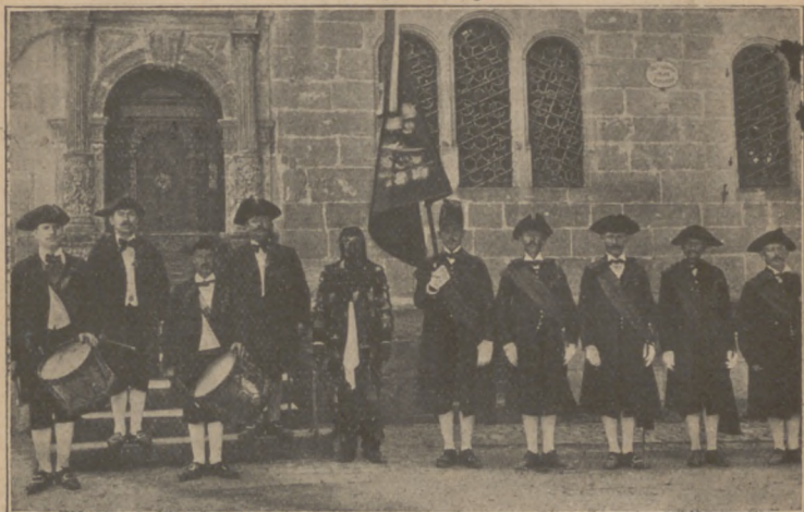
Abb. 11. Überlinger Schwertlestanz.

und springen über einen Degen. Die Kinder singen währenddessen: