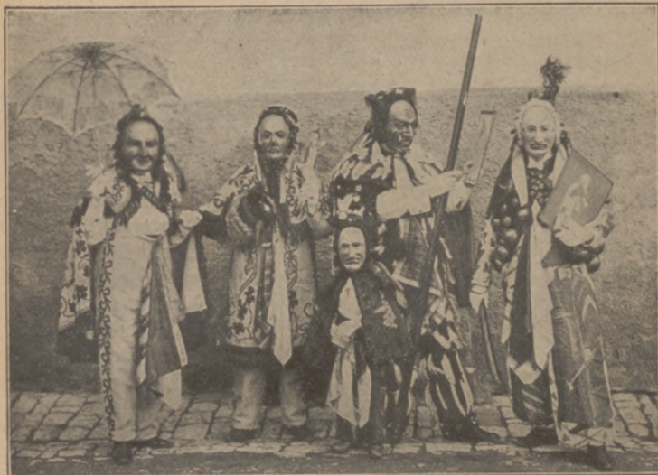
Abb. 8. Rottweiler Hansele.

Weit verbreitet ist die Gestalt des wilden Mannes. Er hat manchmal eine im Aussehen ihm entsprechende Frau, selten ein Kind bei sich. Bisweilen kennt der Volksglaube auch wilde Fräulein. Die wilden Leute treten in der verschiedensten Weise auf. Oft gingen früher Kinder oder Burschen in den Wald und suchten den wilden Mann. Er war in Moos, Baumbart, Rinde oder Laub möglichst wild aussehend gekleidet und hatte ein Bäumchen in der Hand (Abb. 9). Die Kinder führen ihn zu den einzelnen Häusern und werden dafür beschenkt. Manchmal wird er im Wald erschossen, dann aber wieder zum Leben erweckt und als Neuerstandener herumgeführt. Offenbar haben wir hier einen Geist des Wachstums, der frisches Grün und Gedeihen aus dem Wald in die Stadt und ins Dorf bringt. Bisweilen ist der wilde Mann dem Teufel gleichgesetzt und anderen Schreckgestalten, die den Winter darstellen, wie dem Bären. Solche Wesen denkt sich der Mensch auch ohne bestimmten Zweck in Wald und Flur herumstreifend. Heute scheinen die wilden Männer in Sage und Volksbrauch noch am meisten in der Schweiz bekannt zu sein. Ehemals haben sie in Literatur und Kunst auch bei uns eine Rolle ge-