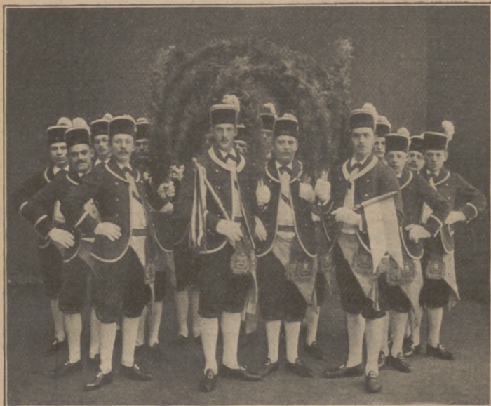
Abb. 12. Schäfflertanz in München.

Eine weithin bekannte Fastnachtsfeier ist der Schäfflertanz in München (Abb. 12). Reinsberg-Düringsfeld 18) schreibt darüber: „Soll dieser Tanz aufgeführt werden, so beschäftigten sich die Schäfflergesellen schon mehrere Wochen vorher damit, alles vorzubereiten und die Tänzer einzuüben. Zugleich wählen sie einen Umfrager, welcher sich erkundigt, wo getanzt werden darf, einen Vortänzer, welcher einen mit Bändern geschmückten Stab trägt, den Reiffchwinger, welcher drei volle Weingläser auf die innere Kante des Reifes frei hinsetzt und keines verschütten darf, obwohl er den Reif mit der größten Geschwindigkeit über dem Kopf und durch die Beine schwingt, und welcher noch überdies den Titel der Herren, vor deren Hause getanzt und deren Gesundheit ausgebracht werden soll, genau wissen und deutlich aussprechen muß, ferner den Nachtänzer, einen Spaßmacher und 16 bis 20 Gesellen, welche den Tanz ausführen. Sie tragen eine grüne Kappe mit weißen und blauen Federn, schwarzes Halstuch, rote Ärmelweste, weiße Weste, Beinkleider von schwarzem Manchester, gelbes Schurzfell, weiße Strümpfe und Schuhe mit silbernen Schnallen, und müssen, während