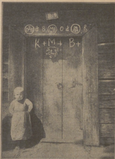
Abb. 5. Türe mit Schutzzeichen.

Die heiligen drei Könige mit ihrem Stern, die essen und trinken und zahlen nicht gern.