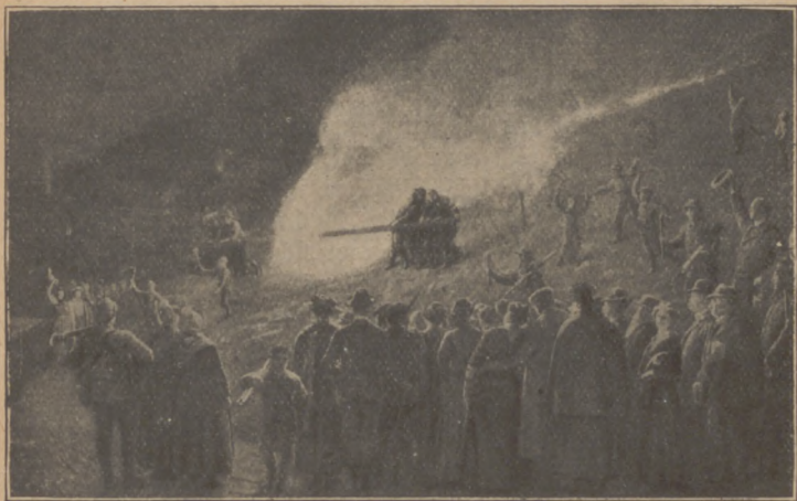
Abb. 6. Sajtnachtsrad in Langental (Hessen).

wie hier der Strohmännchen soll die alte Frau verwendet werden, um welche die Schweizer bitten, wenn sie Brennstoff sammeln: