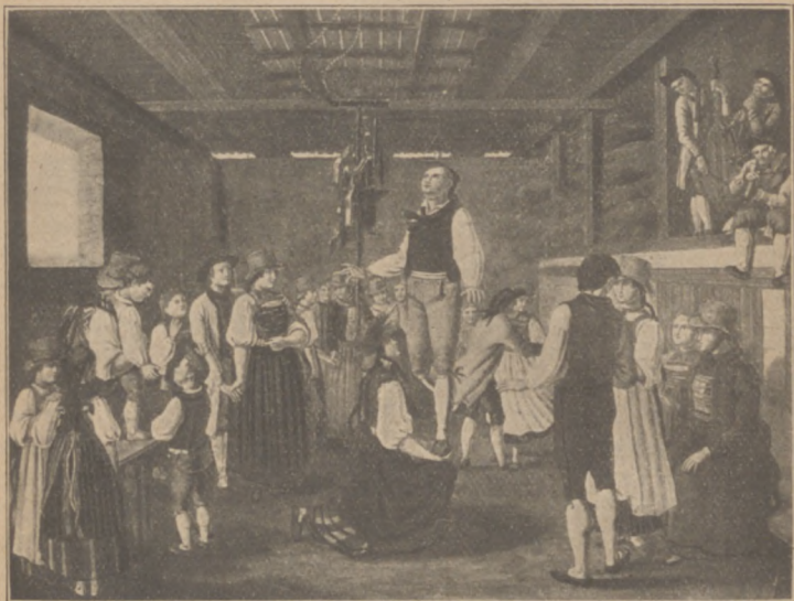
Abb. 20. Hahnentanz in der Baar (Baden).

werden — wird deshalb wie der Schmaus bisweilen Erntehahn genannt.