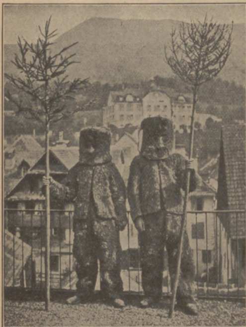
Abb. 9. Die Tschämmeler (Schweiz).

Gabel, die Speßgabel genannt, an welche Würste gehängt werden. So geht's mit Musikbegleitung von Haus zu Haus; in den Häusern wird getanzt. Die Mädchen baden und kochen einstweilen im Festhause, wo die ganze Gesellschaft nach dem Umzug zusammen isst. In Schlesien ist der Mann mit der Gabel und seine Begleitung im Gefolge des Schimmelreiters. Daß wir es hier mit einer Segenshandlung zu tun haben, ist ganz klar, wenn wir den Umzug mit der Gabel in der Roßlauer Gegend vergleichen. Dort versammeln sich die Bauern am Fastnacht-dienstag beim Bürgermeister. Von hier aus gehen sie im Zuge durchs Dorf. Hinter der Musik geht ein Mann mit einer Schüttelgabel, wie man sie zum Ausschütteln des Strohes beim Dreschen braucht. Der Zug geht in die einzelnen Häuser. Überall ist der Tisch gedeckt mit Eierspeise, Wurst, Schinken, Bier und Branntwein. Beim Weggehen bekommt der Gabelträger von der Hausfrau eine große Bratwurst