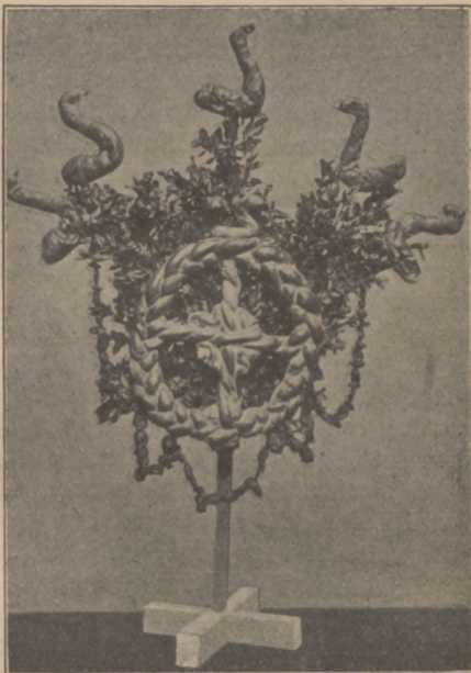
Abb. 15. Palmen aus Holland.

Der früher beliebte Einzug des Heilands auf dem Esel wird jetzt kaum mehr dargestellt. Palmesel ist heute ein Ulname für diejenigen, welche am Palmsonntag zuletzt aufstehen, mit ihrer Palme zuletzt in die Kirche kommen und sonst säumig sind.