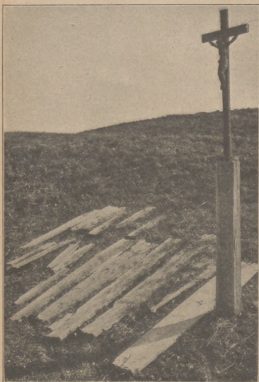
Abb. 29. Totenbretter

geführt worden, sich dadurch dem Toten unkenntlich zu machen. Zu dieser Ansicht führte eine vergleichende Zusammenstellung des Kleiderwechsels bei Trauer: Völker, die im allgemeinen ganz oder fast ganz nackt gehen, bekleiden sich bei Trauer in ihrer Familie oder Nachbarschaft ganz oder beschmieren ihren Körper, so daß sie sehr entstellt aussehen, andere, die im allgemeinen bekleidet sind, gehen bei Trauer nackt. Bei uns ist jedenfalls jetzt von solchen Gedanken keine Rede mehr. Schwarz