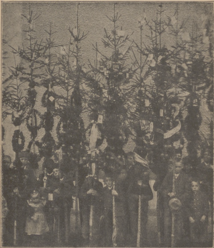
Abb. 14. Palmen aus der Schweiz.

Schwäne, aber auch Brotkränze und Leckereien. Einen Teil davon essen die Kinder nach dem Umzug. Das Brot wird am folgenden Tag zu einem Brei verwendet, dem man große Kraft für die Kinder zuschreibt. Bei uns ist jedes Familienmitglied ein Käzchen der geweihten Palme, um während des Jahres vor Fieber und anderen Übeln bewahrt zu sein. Auch dem Vieh gibt man davon. In einigen Orten der bayrischen Oberpfalz bleibt der Hausherr nüchtern, bis