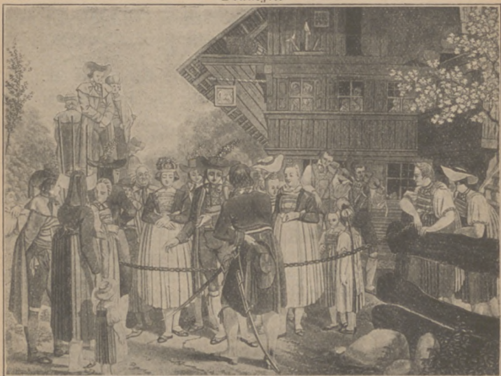
Abb. 24. Vorspannen.

Hausstand, das „Glücksbrot“. Bisweilen ergeht die Einladung durch Verwandte, durch den Brautführer und eine Brautjungfer oder durch den Küster. Öfters ist dazu ein besonderer Hochzeitsbitter bestellt. Er ist bunt geschmückt, hat einen Degen oder Stab oder wenigstens einen Regenschirm bei sich und sagt seine Einladung in Süddeutschland meist sehr kurz, in Norddeutschland dagegen oft in einem weitschweifigen Spruch her.