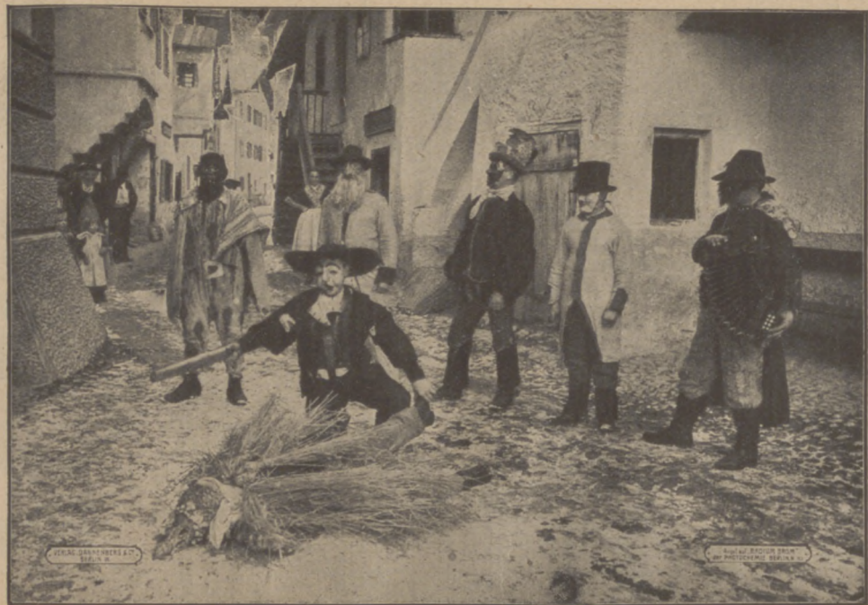
Abb. 3. Die Glöckelfänger.