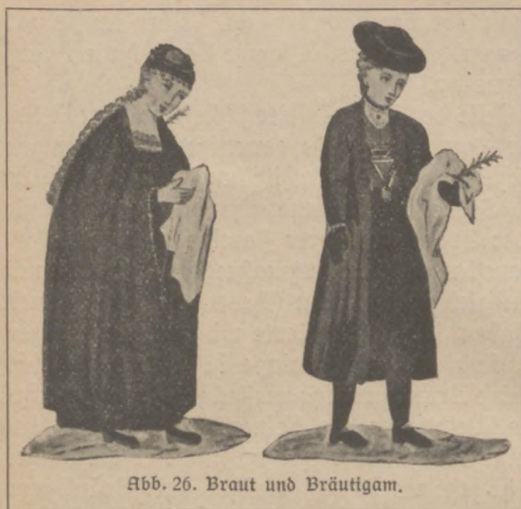
Abb. 26. Braut und Bräutigam.

Schießen sind für die Fahrt nach der Kirche und zurück noch andere Vorschriften gegeben. Man fährt sehr schnell und nur auf bestimmten Wegen, vor der Heimfahrt von der Trauung reitet man einige Male um den Bräutigam oder geht zu Fuß um das Brautpaar herum, oder der Bräutigam umkreist allein seine Braut. Dadurch wird um die Schutzbedürftigen ein