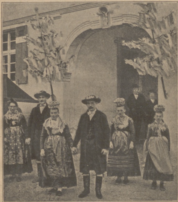
Abb. 27. Hochzeit aus dem Kinzigtal (Baden).

mergrünen Blättern auf außergewöhnliche Lebenskraft und Segen. Er ist aus der Antike übernommen und wird jetzt meist als Kennzeichen für die keusche Braut angesehen. Mädchen, die vor der Hochzeit schon ein Kind hatten, tragen deshalb an vielen Orten keinen Myrtenkranz. 42) Nach der Rückkehr aus der Kirche wurde die Braut bisweilen nach uralter Sitte mit Getreidekörnern und Erbsen überschüttet. Vor der Braut steht in der Uckermark beim Essen der Brautapfel auf drei Goldstücken, die von den nächsten Verwandten geschenkt sind. Auch andere Gäste stecken Geldstücke in den Apfel. Während des Hochzeitseffens, des Tanzens und vor allem beim Heimfüh-