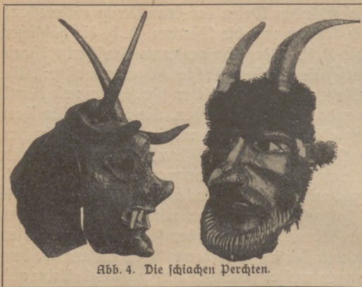
Abb. 4. Die schiachen Perchten.

Pongau in Landestracht, ein Bursche als Mann, einer als Frau. Der Mann hat einen auffallend hohen, ihn selbst fast um das Doppelte überragenden Kopfsatz. In der Hand hält er einen Degen. Den schönen Perchten folgen einige Gestalten mit Teufelsmasken,