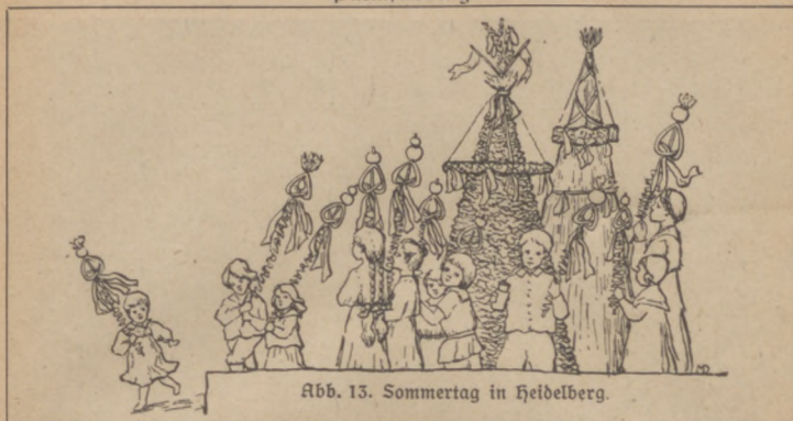
Abb. 13. Sommertag in Heidelberg.