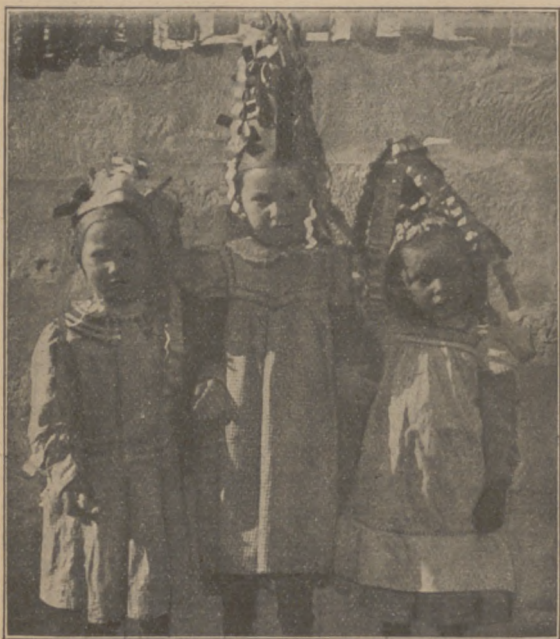
Abb. 17. Hexen aus Schmalkalden.

fern und bestreicht damit die Kühe, um sie vor Krankheit zu behüten. Schweißen ist geboten, wenn man am Johannistag neuerlei Kraut sammelt, das vor Krankheit schützen soll.