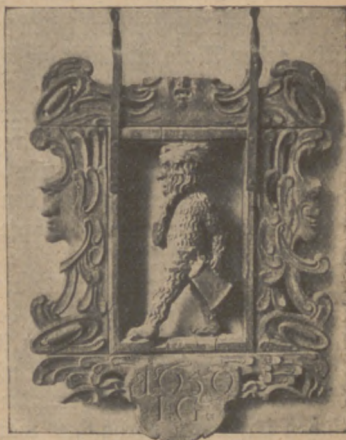
Abb. 10. Wirtshauszeichen aus Ponte (Schweiz).

Oft haben einzelne Zünfte einen Teil der Fastnachtsfeier, vor allem Umzüge und Tänze, besonders gepflegt, sie als ein Vorrecht ihrer Zunft erachtet und übertragen bekommen und mit großem Gepränge aufgeführt. Weit verbreitet sind Waffentänze. 17) Wir können sie etwa durch 3000 Jahre verfolgen und treffen sie bei vielen Völkern der Erde. In Deutschland waren sie weit bekannt und meist an Fastnacht gefeiert. Sie sind zum großen Teile vergessen. Bisweilen hat man, wie in Schmalkalden in Thüringen, versucht, sie wieder zu erneuern. Zu den wenigen Städten, wo sie noch seit alter Zeit in Übung sind, gehört Überlingen am Bodensee. Die ledigen Rebleute der Neustadt beanspruchen hier das Recht, den Tanz aufzuführen. Vier Platzmeister, ein Fähndrich und ein Säckelmeister bilden den Vorstand der Gesellschaft. Sind die Vorbereitungen fertig, so wählen sie ein Hansel, wie es auch sonst an Fastnacht in Überlingen umzugehen pflegt (Abb. 11). Unter den Klängen eines alten Marsches ziehen die Tänzer auf einige Plätze der Stadt. Dort tanzen sie in künstlich verschlungenen Reihen Achter und andere gewundene Gebilde, gehen unter den gekreuzten Degen durch