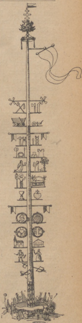
Abb. 18. Maibaum aus Ellbach.

Einen Maien errichtet man in gleicher Gestalt auch bei anderer Gelegenheit, einem jungen Ehepaar als Segenswunsch, wenn ein neues Haus ausgerichtet ist, einem neugewählten Bürgermeister, wenn ein neuer Gastwirt seinen Betrieb eröffnet. Deutlich ausgesprochen ist die beabsichtigte Segenswirkung des Maien, der jungen Eheleuten am Hochzeitstage gesetzt und nach der Geburt des ersten Kindes in aller Stille entfernt wird. Der Segen kann auf