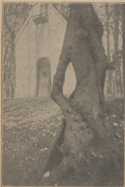
Abb. 21. Baum zum Durchziehen.

orts ihr Patentkind an der Erbschaft teilnehmen. Man benennt Kinder nach den Paten. Daneben gibt man häufig die Namen der Großeltern, besonders dem Stammhalter den Namen des Großvaters. Das geht auf den Glauben zurück, daß die Seele des Großvaters im Enkel weiterlebe. Bezeichnend für diesen Glauben ist eine Erzählung Rosegggers im Höllbart: Der Großvater ist begraben worden. „Der Hausvater nahm das jüngste Kind aus dem Arm der Mutter und stellte es über den Hügel, daß die nackten Füßchen die Erde berührten. Als dies geschah, gab er den Kleinen der Mutter und sagte: ‚Nimm, Weib, du hast du den Großvater jung und frisch wieder zurück.‘“ 31)