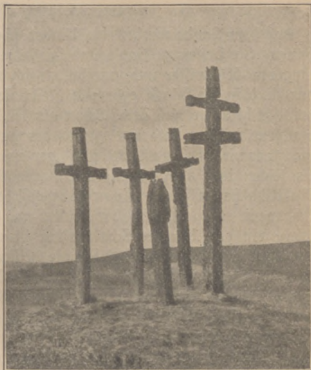
Abb. 23. Pestkreuze.

Manche Reste solcher Zaubervorschriften leben noch weiter, ohne daß diejenigen, welche sie anwenden, sich dessen bewußt sind. Oft kann man beobachten, daß eine Mutter, die ihrem Kinde den verletzten Finger verbindet, keinen Knoten macht, sondern den Faden zudreht. In den meisten Fällen weiß die gute Mutter nicht mehr, daß sie nach altem Zauberglauben mit dem Zubinden auch die „Heilung zubinden“ würde; sie hat bei ihrer Mutter in solchen Fällen das Zudrehen gesehen und macht es auch so, wenn sie auch sonst bei jedem Knopf, den sie annäht, sorgfältig einen Knoten macht.