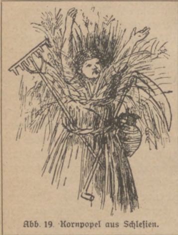
Abb. 19. Kornpopel aus Schlesien.

und bewahren das Haus vor Blitzgefahr. An Weihnachten gibt man davon dem Vieh zu fressen, damit es gesund bleibe. Um die Segenswirkung durch eine ungeeignete Person nicht zu verderben, mußte in Baden früher eine Braut die letzte Garbe oder ein unschuldiges Mädchen oder wenigstens die jüngste Schnitterin die letzten drei Ähren schneiden. Die frühere Sitte in Mecklenburg, am Erntefest eine Hochzeit zu feiern, wozu nur unbescholtene Brautpaare die Ehre hatten, zeigt wieder, wie eine menschliche Segenshandlung in Beziehung gesetzt wird zum vegetabilischen Leben.