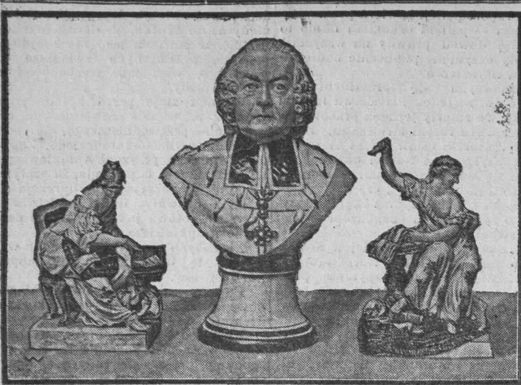
Niemcy sprzedają „Kurfuersta“.

Nasz obrazek przedstawia porcelanową figurę Wielkiego Elektora Brandenburskiego, twórcy potęgi pruskiej, którą wystawiono na sprzedaż w Darmstacie. Po obu stronach Elektora znajdują się figurinki według modelu W. Beyera. Pochodzą one 19. wieku. Wyprowadź ta jednak nie znaczy, że Niemcy się wyrzekają swych zabor-