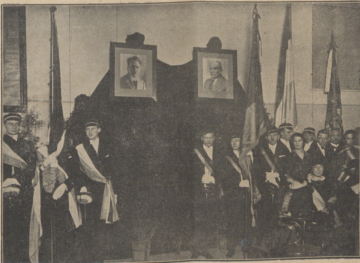
Uroczysta Akademia w Uniwersytecie Warszawskim ku czci Żeromskiego i Reymonta. Staraniem Rektora i Senatu Uniwersytetu Warszawskiego, odbyła się akademja a zalobna ku czci Żeromskiego i Reymonta. Pięknym momentem akademji było złożenie wieńców z jedliny przez delegacje młodzieży akademickiej na katafalku symbolicznym, ustawionym na sali.