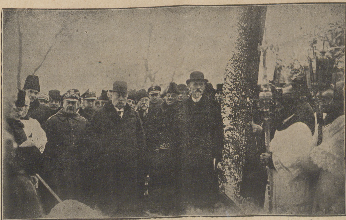
W hołdzie pamięci ks. Stanisława Staszycy. Pan Prezydent Rzeczypospolitej przy grobie St. Staszycy na Bielanach.