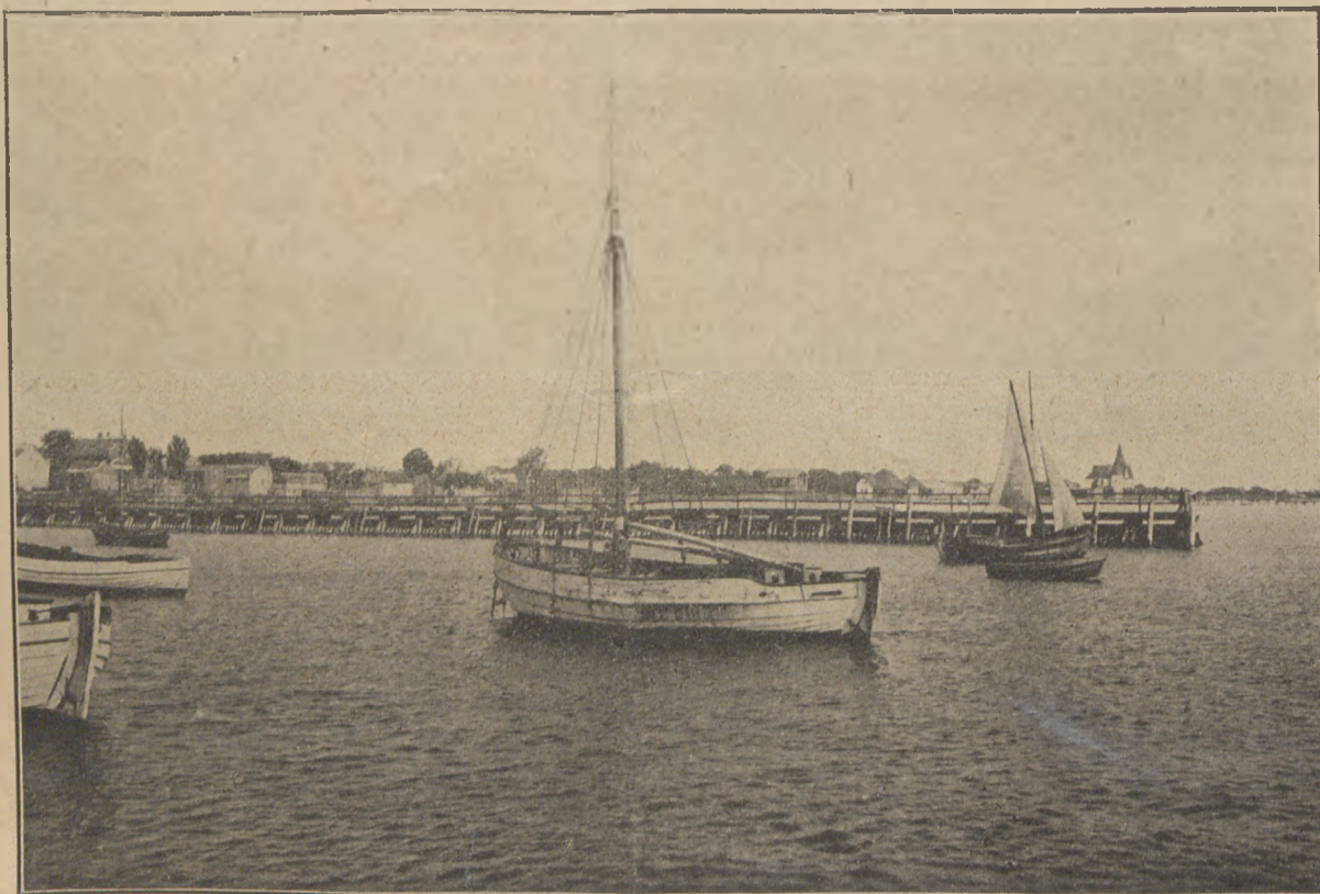
Port w Helu.