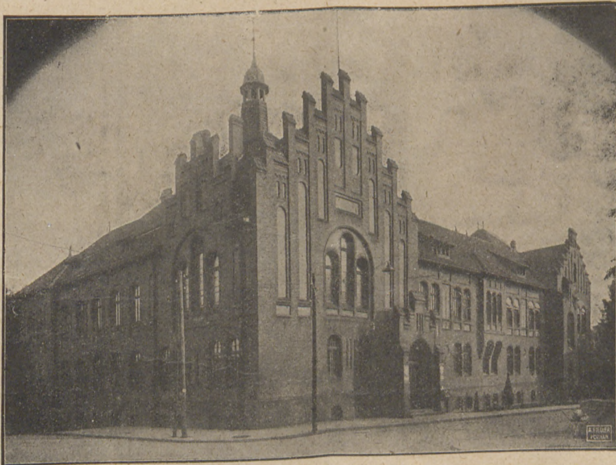
Gmach Starostwa w Grudziądzu.