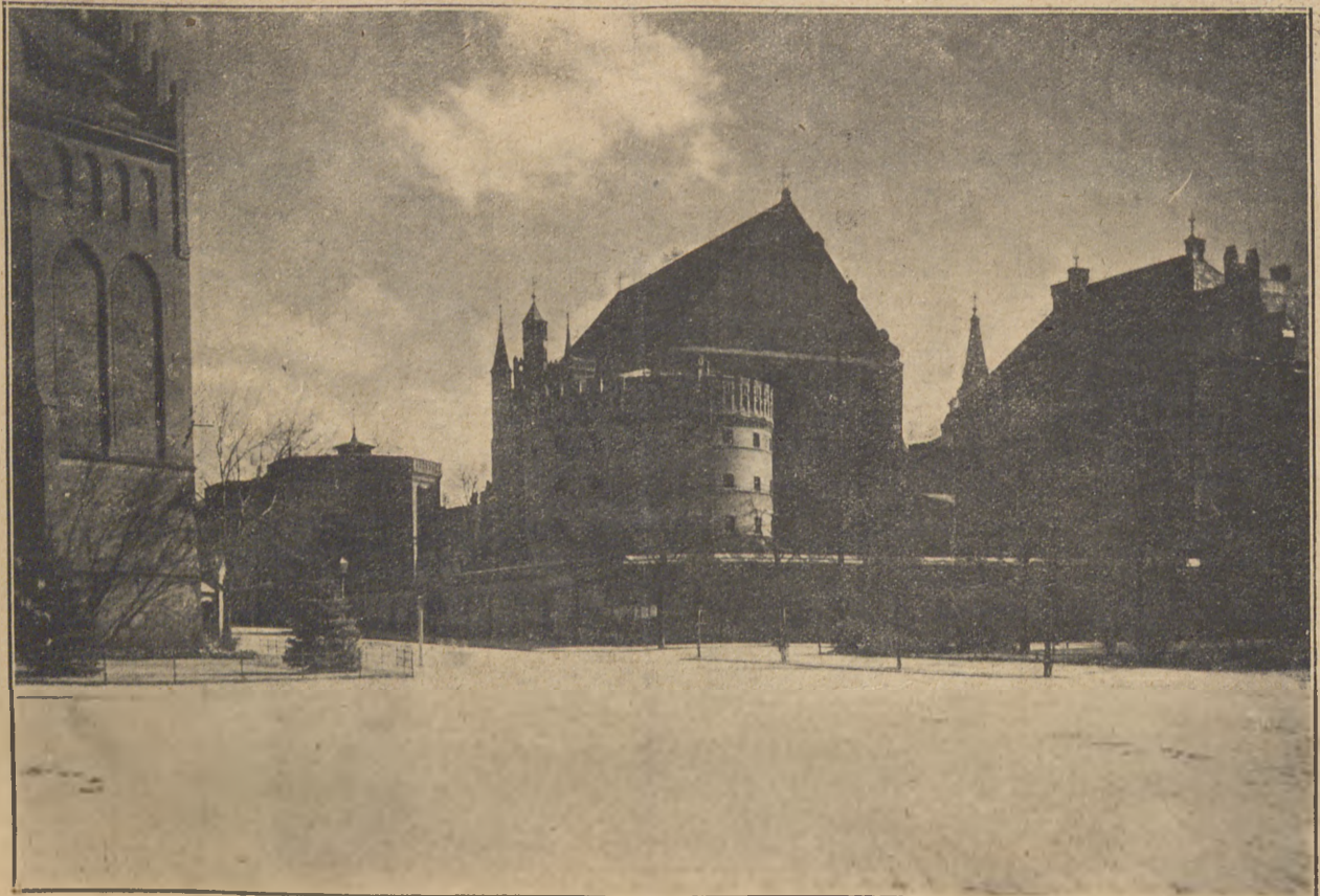
Widok z Torunia.