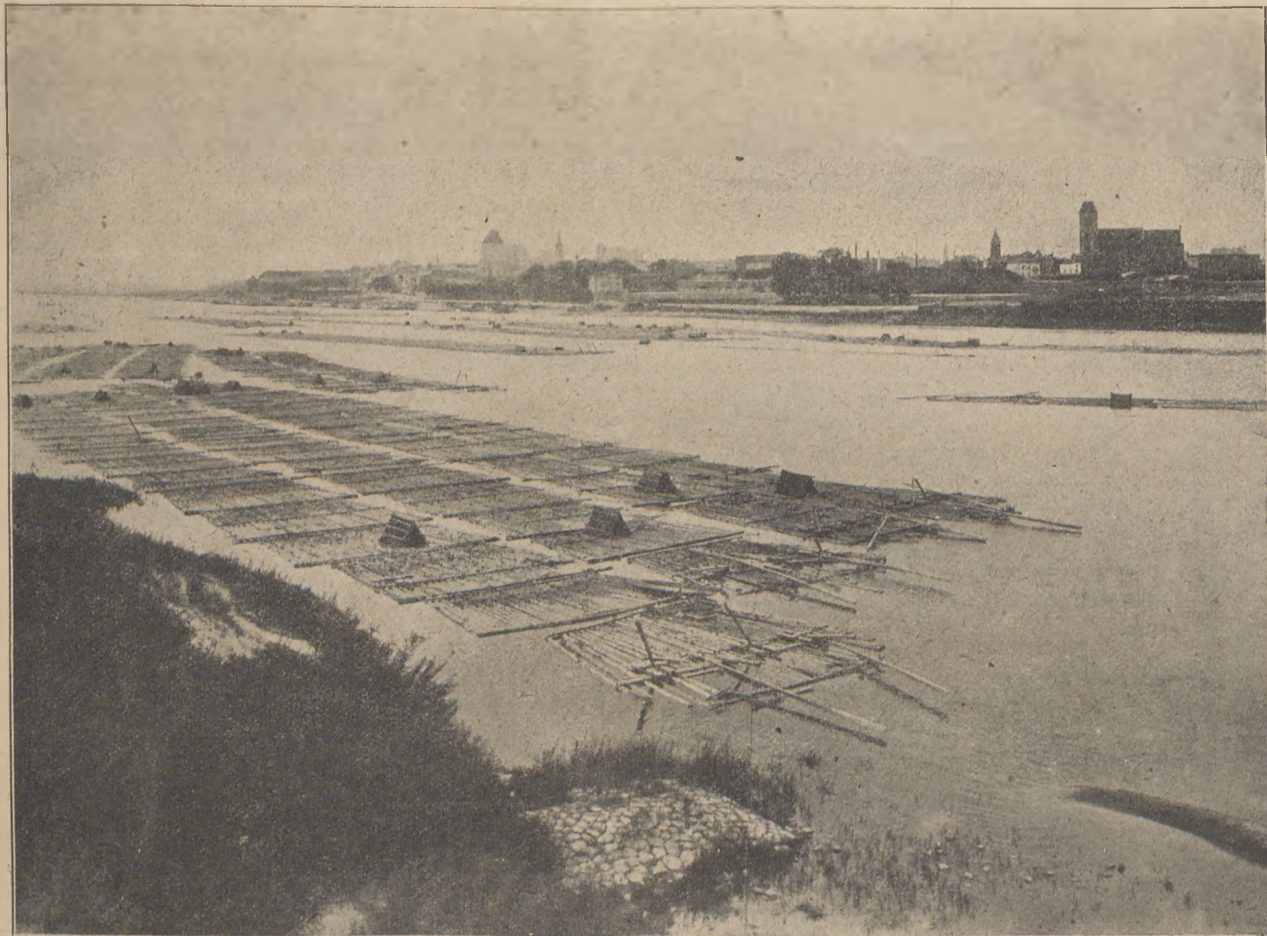
Wisła pod Toruniem.