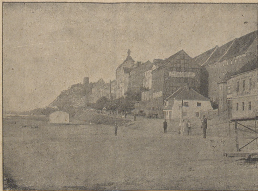
Grudziądz. Spichrze nad Wisłą.