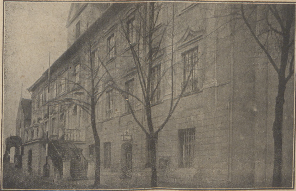
Grudziądz. Ratusz. I.