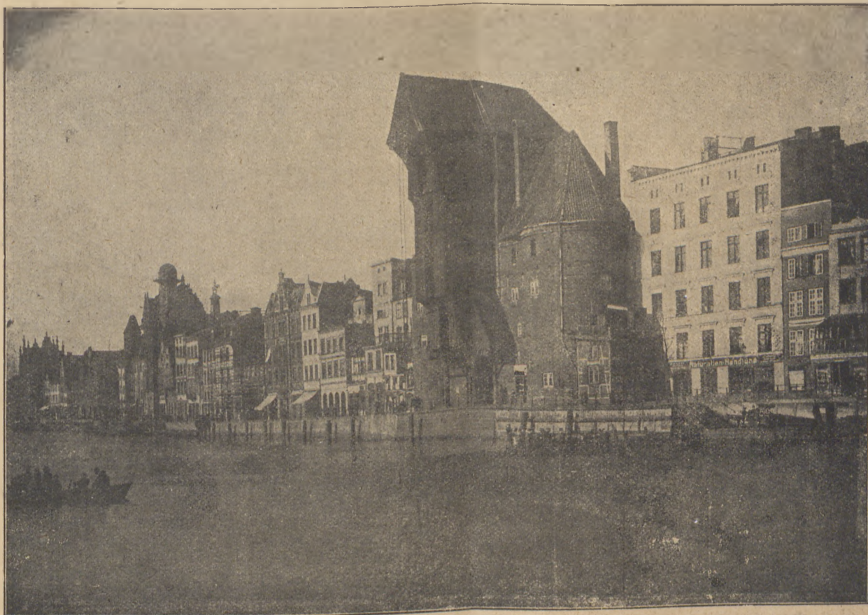
Widoki z Gdańska.