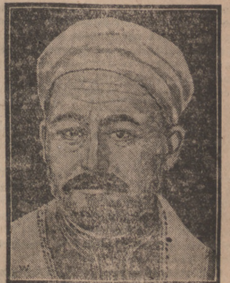
ABD-EL-KRIM, PRZYWÓDCA POWSTAŃCÓW MAROKAŃSKICH, ZOSTAŁ RANNY.

Odkrycie to wywołało niebывалą sensację i pograżyło w nieopisaną boleść krewnych tak tragicznie zmarłego. Scena, jaka się rozgrywała przy otwartym grobie, jest nie do opisania.