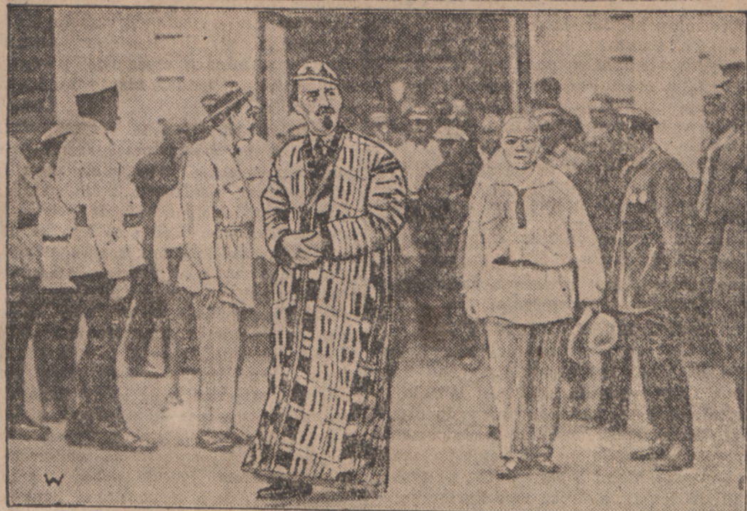
TARGI W NIŻNYM NOWOGRODZIE. Na słynne targi w Niżnym Nowogrodzie zjeżdżają się także kupcy azjatyccy. Ilustracja nasza przedstawia kupca turkестаńskiego w stroju narodowym.