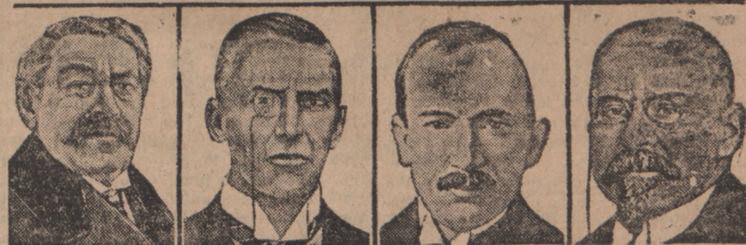
DELEGACI LIGI NARODÓW W GENEWIE.

Mieszkania dla uczestników Targów wzniesła biuro mieszkaniowe na dworcu w Lwowie.