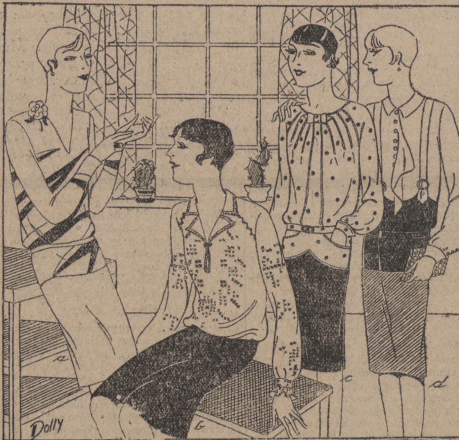
Nowe i oryginalne bluzki.

*) Aluzja do słów Mussoliniego: „Powinien się wnieść las karabinów, który zasłoni niebo Italii“.