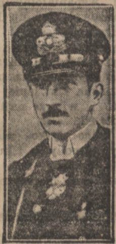
KRÓL BULGARII BORYS.

Istnieje bowiem podejrzenie, że ogień został tam podłożony. Policja śledczy prowadzi dochodzenia nadal. Czy sprawa zostanie jednak wyswietlona, jest mało prawdopodobnym, albowiem wszystkie domniemane zbrodni dowody, o ile jakie istniały, zniszczył pożar.