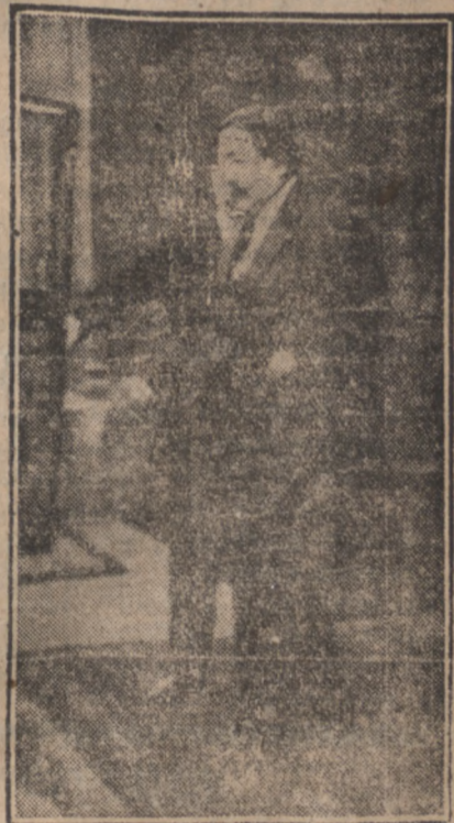
P. Painleve po otrzymaniu misji utworzenia gabinetu opuszcza Pałac Elizejski.

Jak donosi „Chicago Tribune” z Meksyku, miasto Sombretete w stanie Zacatecas zostało niemal doszczętnie zniszczone przez wybuchy sąsiednich wulkanów i równoczesne trzęsienie ziemi. Liczba ofiar wynosi przypuszczalnie przeszło 1.000 osób.