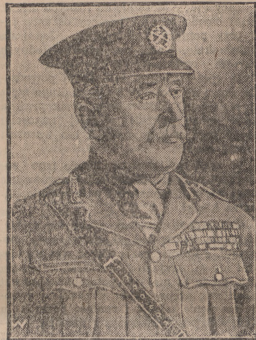
MARSZAŁEK FRENCH UMIERAJĄCY.

Po ukończeniu takiej nieraz kilkumiesięcznej kampanji bandyci wracają jak regularni żołnierze do swych pułków.