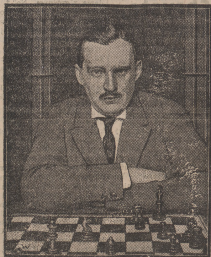
SLYNNY SZACHISTA ALECHIN

*) Na tle różnych ustaw i przepisów łowieckich.