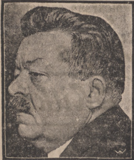
PREZYDENT RZESZY NIEM. EBERT, który przeżył codopiero ciężką operację według ostatnich wiadomości jest umierający.

Według ostatnich wiadomości stan zdrowia prezydenta Rzeszy jest zupełnie zadowolający. Rekonwalescencja potrwa prawdopodobnie około 3 do 4 tygodni.