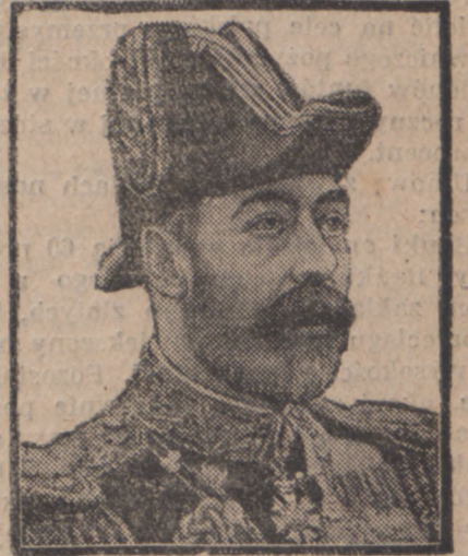
KRÓL JERZY V.