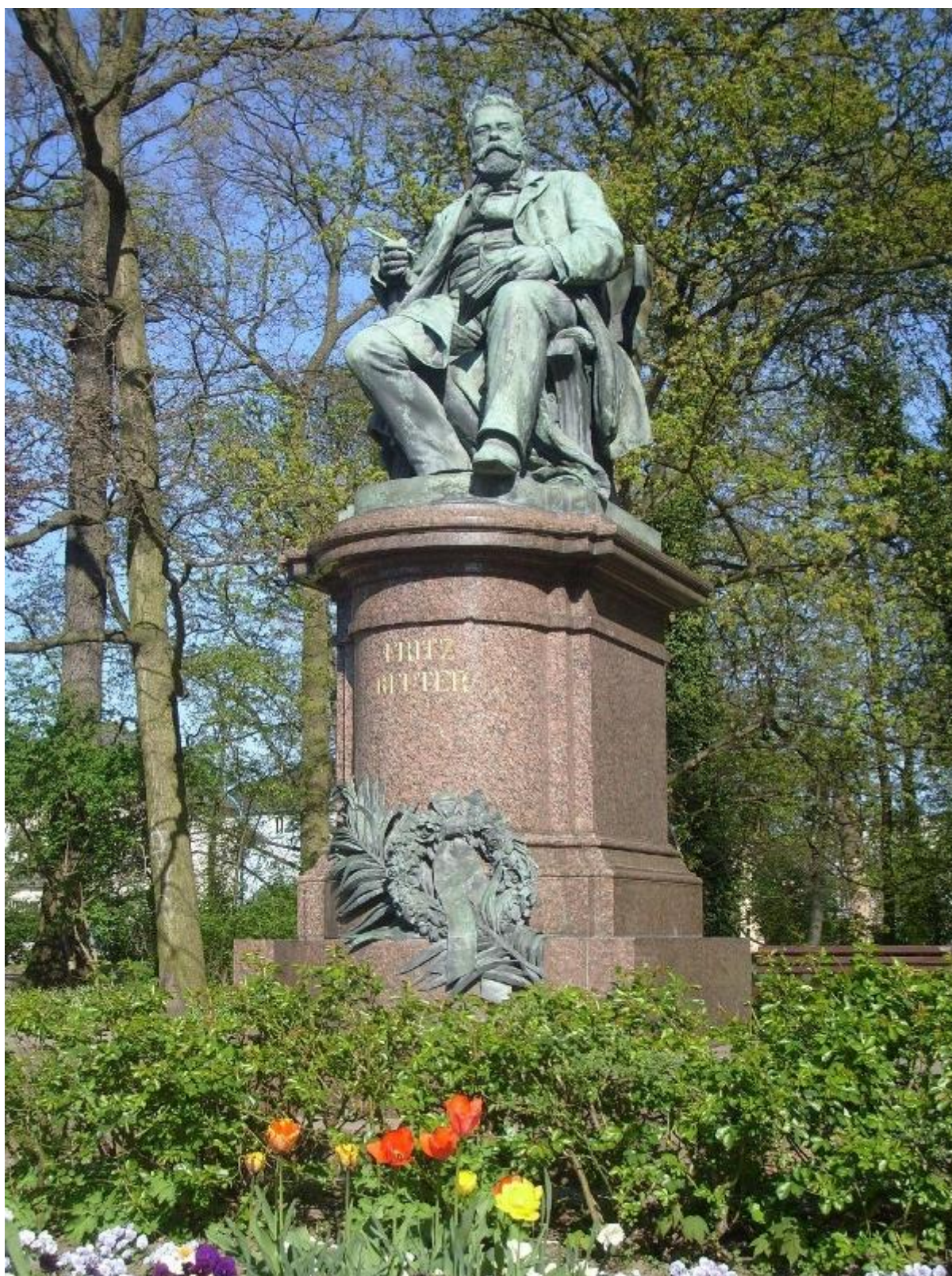
Pomnik Fritza Reutera w Neubrandenburg. Domena publiczna.

Utwory Reutera doczekały się wielu tłumaczeń. Są dostępne przekłady w językach: angielskim, duńskim, fińskim, francuskim, holenderskim, japońskim, norweskim, polskim, rosyjskim, rumuńskim, szwedzkim, włoskim, a nawet fryzyjskim.