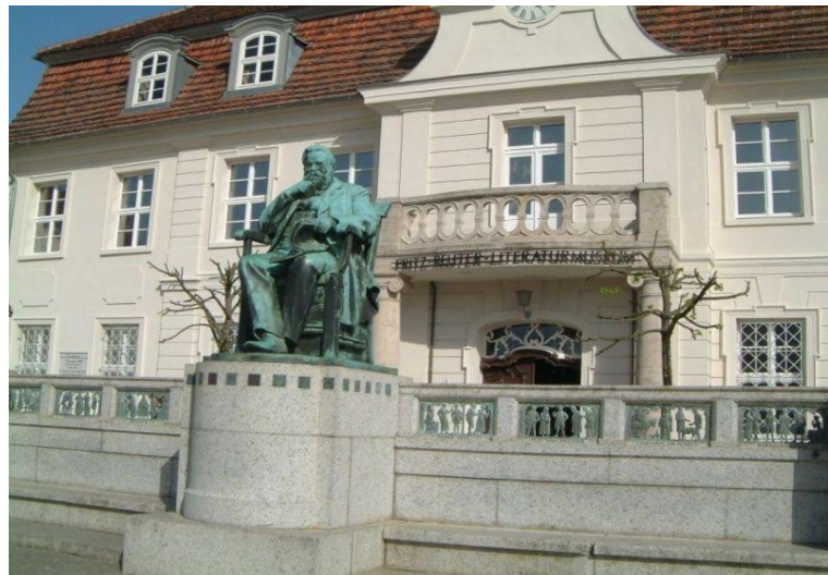
Chicago Park District Monument Fritza Reutera. Po prawej Pomnik Fritza Reutera w Stavennhagen. Domena publiczna.