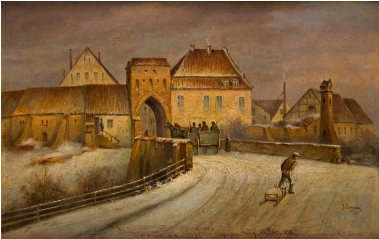
Obraz Gustava Breuninga z 1901 r. – przedstawiający scenę przewiezienia Reutera do Grudziądza.