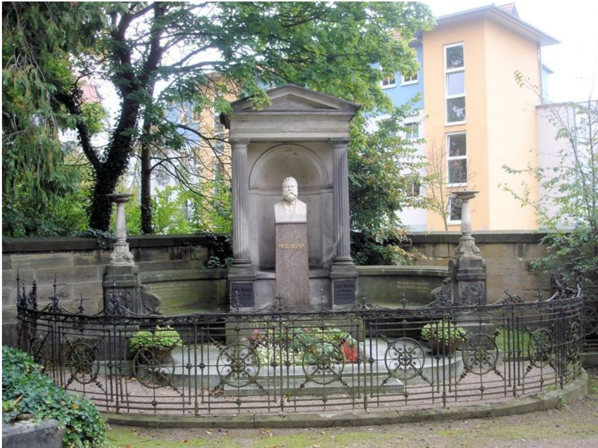
Eisenach. Grób Fritza Reutera. Domena publiczna.