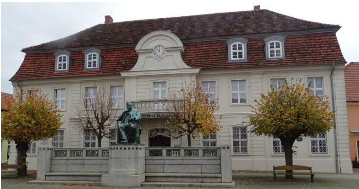
Muzeum F. Reutera w Eisenbach.

Pamięć o poecie i pisarzu kultywowana jest do dnia dzisiejszego. Już w 1910 roku w budynku dawnego ratusza miejskiego w Stavenhagen utworzono wystawę, upamiętniającą słynnego syna miasteczka; przekształciła się ona w Muzeum Literatury im. Fritza Reutera, które powstało w 1949 roku. W 1960 roku jego ekspozycja zajęła cały gmach. Należy ono do najbardziej interesujących muzeów literatury na terenie Niemiec. Udostępnione tu są przedmioty codziennego użytku literata, jego szkice i obrazy, rękopisy, listy, a także dzieła malarza i ilustratora Ernsta Lübbertha. Przed budynkiem muzeum podziwiać można rzeźbę, przedstawiającą Fritza Reutera, wykonaną przez Wilhelma Wandschneidera, a po jej obu stronach granitowe ławy z reliefami, które inspirowane są twórczością pisarza.