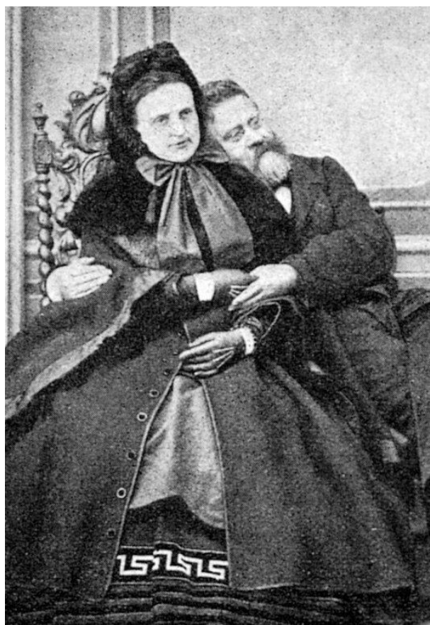
Fritz Reuter z żoną. Domena publiczna.