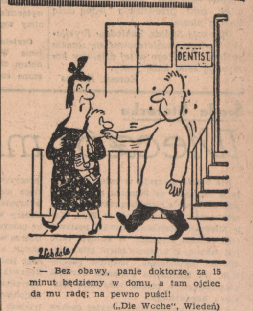
— Bez obawy, panie doktorze, za 15 minut będziemy w domu, a tam ojciec da mu radę; na pewno puści! („Die Woche”, Wiedeń)

REDAKCJA I ADMINISTRACJA W BYDGOSZCZY ul. Czerwonej Armii 20. — Telefon nr 33-41 i 33-42. DZIAŁ OGŁOSZEŃ W BYDGOSZCZY ul. Generalissimusa Stalina 2 (Pod Arkadami). Tel. 24-29. Prenumerata: pocztowa 3,60 zł, przez roznosiela 3,90 zł miesięcznie. Reklamistów niezamówionych Redakcja nie zwraca. — Za ogłoszenia Redakcja nie odpowiada.