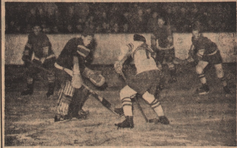
Zgrupowani w Katowicach na obozie przedolimpijskim najlepsi hokeiści Polski rozegrali treningowe spotkanie dwu teamów, zakończone zwycięstwem zespołu B 6:2 (1:0, 2:1, 3:1).