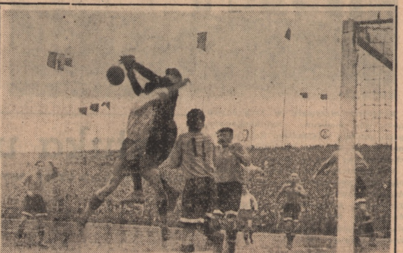
Spotkanie piłkarskie między Dynamo Tbilisi, a CWKS-em rozegrane w niedzielę, dnia 11 listopada br. w Warszawie, na stadionie Wojska Polskiego, zakończyło się zwycięstwem Dynamo 2:0. Wynik meczu ustalony został już w pierwszej połowie gry. Zawodom piłkarskim przyglądało się około 50 tysięcy widzów. Na zdjęciu: Margania piątkowaniem ratuje groźną sytuację pod bramką Dynamo.

Spotkanie zakończyło się wynikiem nierozstrzygniętym 1:1 (1:0).