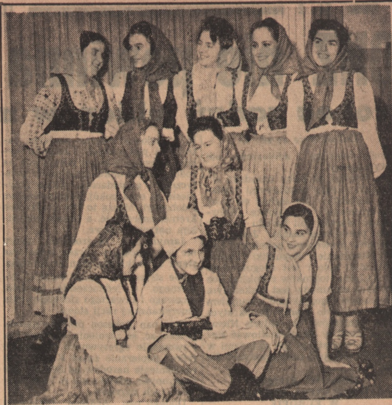
Doniosłą rolę w zacieśnianiu łączności miasta z wsią mają zespoły świąteczne. Jednym z dobrze spełniających to zadanie zespołów jest amatorska grupa artystyczna Spółdzielni Wydawniczej „Prasa Demokratyczna — Nowa Epoka“ w Bydgoszczy, której miłe buzie widzimy na zdjęciu. Ostatnio zespół ten wystąpił wśród robotników rolnych PGR Komierowo, chłopów Spółdzielni Produkcyjnej w Wąsoszku oraz w sanatorium w Smukale.

Przewodniczącym komitetu mianowany został znakomity poeta radziecki — Mikołaj Tichonow.