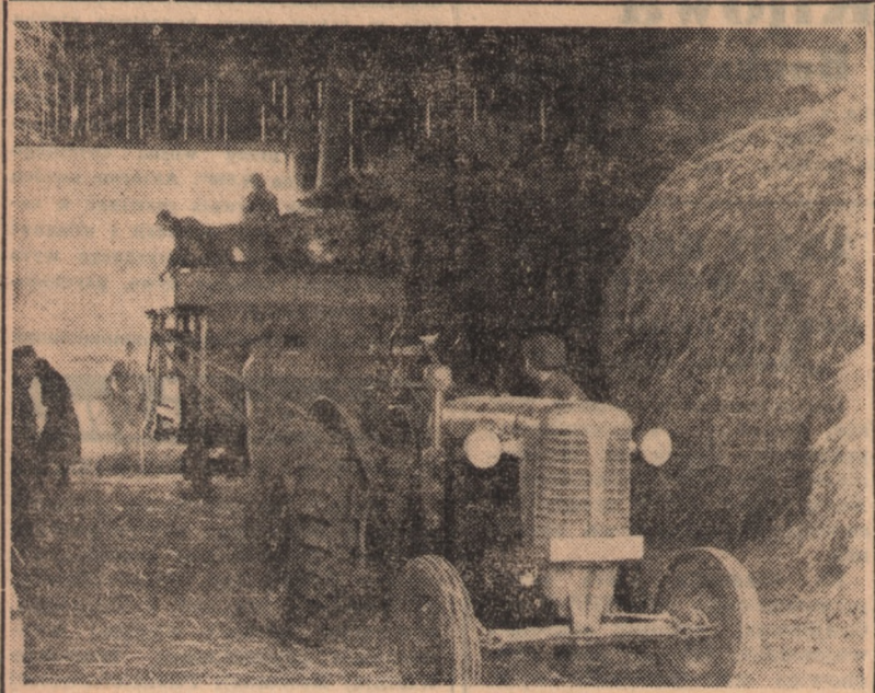
Gospodarstwo Gminnej Spółdzielni „Samopomoc Chłopska” w Strzałkowie woj. kieleckiej, pragnąc świecić przykładem indywidualnym chłopom, przystąpiło do ostatniej fazy omlotów.

W meczu piłki wodnej zwyciężyła Stal 7:5.