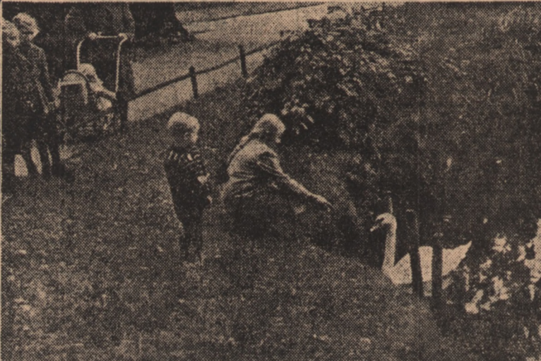
Wyjdźmy na spacer z naszymi pociechami, aby wykorzystać jeszcze ostatnie słoneczne dni październikowe.