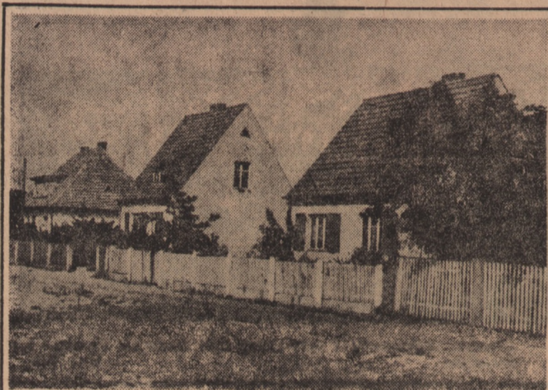
W Pilichowie pod Szczecinem powstaje wzorowe osiedle dla nauczycieli. W 22 domkach jedno i dwurodzinnych wyposażonych w nowoczesne urządzenia, już wkrótce zamieszkażą nauczyciele szkół szczecińskich.