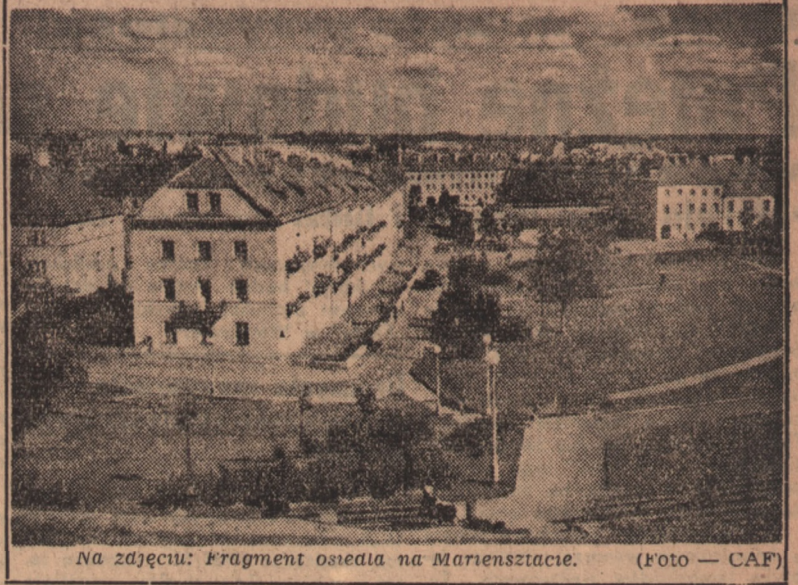
Na zdjęciu: Fragment osiedla na Mariensztacie.

PARYŻ (PAP) W wyborach uzupełniających do rady miejskiej w Mandelieu, w departamencie Alpes Maritimes zdecydowane zwycięstwo odnieśli komuniści,