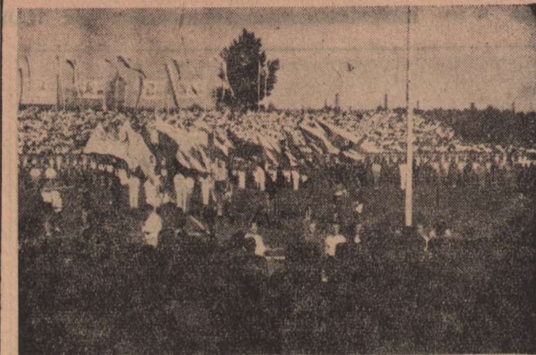
Uroczyste zakończenie I Spartakiady było niezwykle barwnym widokiem.

CZĘSTOCHOWA. W Częstochowie odbyło się oficjalne otwarcie przebudowanego toru żużlowego Włóknarza, połączone z meczem o mistrzostwo ligi między Ogniwo i Włóknarzem. Mecz zakończył się wysokim zwycięstwem Og-