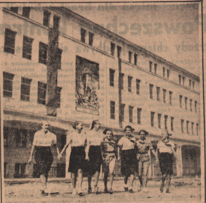
Rozpoczęcie nowego roku szkolnego obchodzone było w całym kraju b. uroczystie. Działwa szkolna powitała ten dzień niezwykle radośnie. Na zdjęciu dziewczęta ze szkoły im. Jarosława Dąbrowskiego w Warszawie.

WARSZAWA (PAP) W godzinach wieczornych 3 bm. w dalszym ciąguwały obrady Rady Międzynarodowej o Związku Studentów. Obradom przewodniczył przedstawiciel studentów radzieckich Władimir Wdowin. W dyskusji nad sprawozdaniem Komitetu Wykonawczego MZS głos zabierali przedstawiciele studentów: Portugalii, Indii, Hiszpanii republikańskiej, Związku Demokratycznych Studentów Afryki, Afryki Zachodniej, Boliwii, Włoch, Japonii, Ekwadoru i Kambodży.