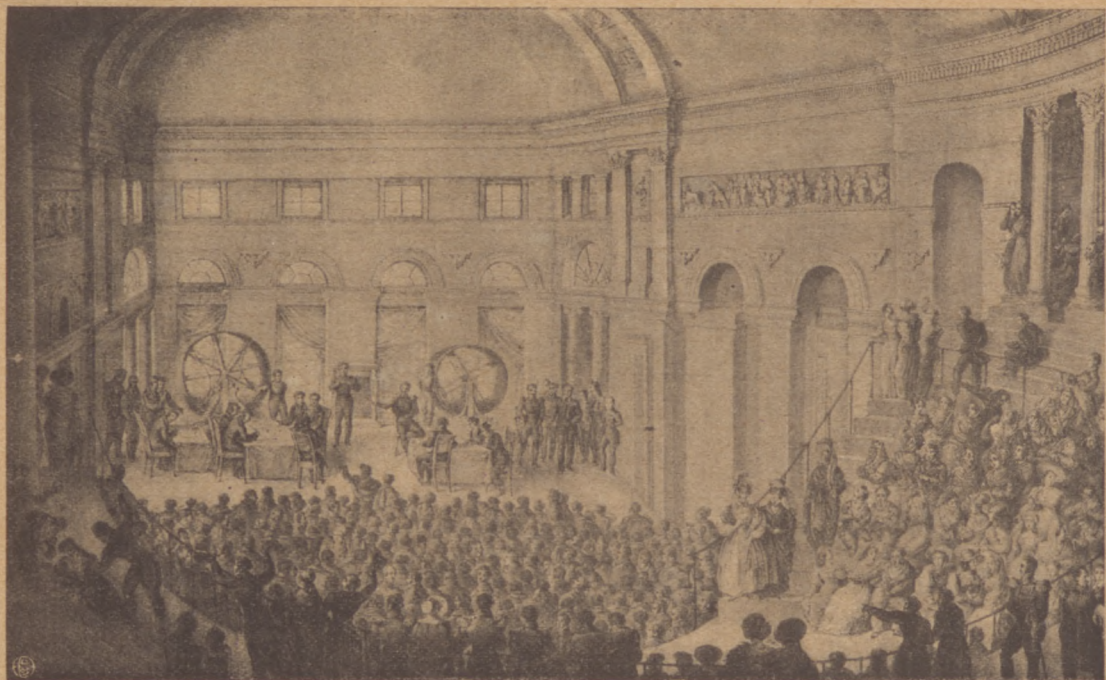
— 17 — Ciągnięcie loterii Królestwa Polskiego w wielkiej sali pałacu Staszica około 1840 r..