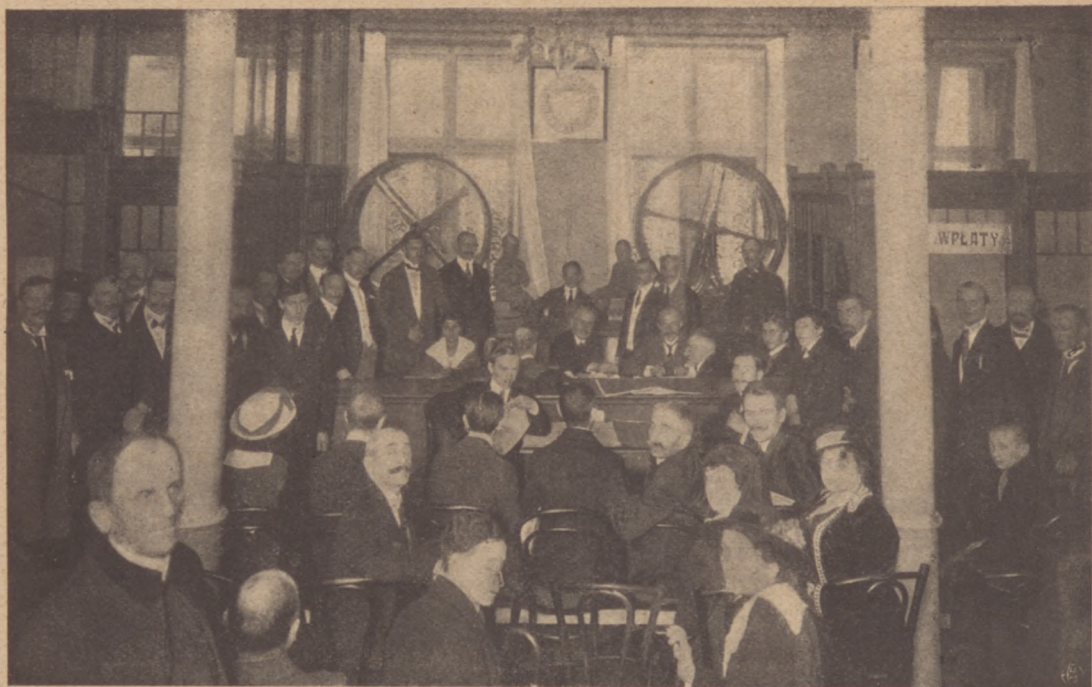
Ciągnienie II-ej loterji R. G. O. d. 17 sierpnia 1917 r.