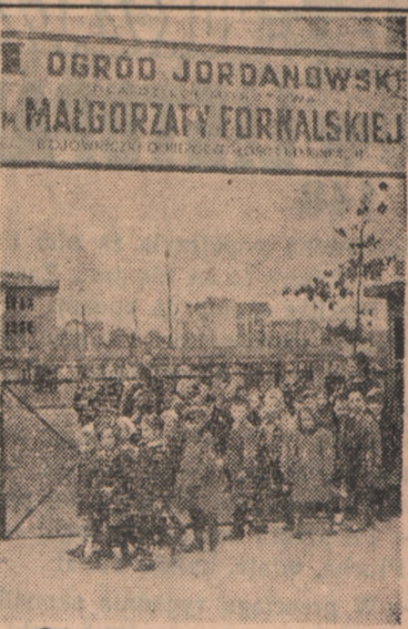
Od kilku dni rozpoczęły się w warszawskich ogródkach jordanowskich zajęcia na świeżym powietrzu. Młodzi obywatele są bardzo zadowoleni z tego, ponieważ sałe w przedszkolach, aczkolwiek duże, nie dają takiej swobody ruchów jak ogródek. Piłka, żelazki, piaskornice, gry i zabawy ruchowe — to chyba szczyt zimowych marzeń każdego przedszkolaka. Ciepłe, wiosenne słońce pozwala na ich realizację. Na zdjęciu: Para za parą. Idą przedszkolaki na pierwszy wiosenny spacer.

W elektrycznym pociągu, zbliżającym się do Jokohamy wybuchł z niewiadomych przyczyn pożar. Maszynista zatrzymał natychmiast pociąg, lecz aparatura pneumatyczna, otwierająca automatycznie drzwi wagonów zacięła się tak, że pasażerowie zaczęli wybijać szyby i wyskakiwać na tor. 98 osób nie zdążyło opuścić pociągu i spłonęło żywcem.