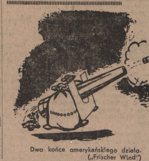
Dwa końce amerykańskiego działła. („Frischer Wind“)

REDAKCJA I ADMINISTRACJA W BYDGOSZCZY ul. Czerwonej Armii 20. — Telefon nr 53-41 i 33-42. DZIAŁ OGŁOSZEŃ W BYDGOSZCZY ul. Generalissimusa Stalina 2 (Pod Arkadami), Tel. 24-29. Prenumerata: pocztowa 3,60 zł, przez roznościela 3,96 zł miesięcznie. Reklamów: niezamówionych Redakcja nie zwraca. — Za ogłoszenia Redakcja nie odpowiada.