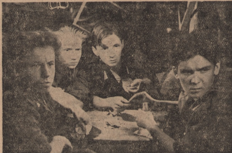
Scena z filmu „Pierwszy start“