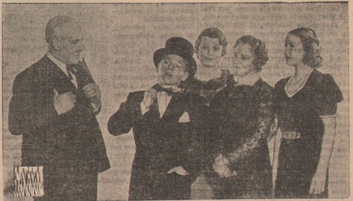
Scena z najnowszego filmu z cyklu „Rodzina sędziego Hardy” — p. t. „Miłość Andy Hardy’ego”. Na pierwszym planie — Lewis Stone i Mickey Rooney.

W Ameryce i wielu krajach Europy do największych sukcesów zaliczają się filmy z serii „Sędzia Hardy”. Spośród tych obrazów w Polsce ukazał się tylko jeden: „Pierwsza miłość”. Powodzenie filmów tej serii przechodziło różne fazy. Były nawet wypadki — co prawda na początku — gdy publiczność objawiała niechęć do tych obrazów.