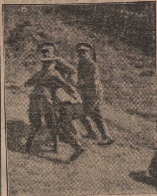
żona prowadzonego mężczyzny, uderzona brutalnie pięścią, leży bezsilna na ziemi.