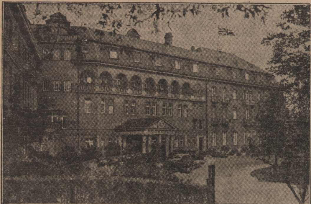
Hotel w Godesbergu, w którym zamieszkał premier Chamberlain. Reprodukcje z hotelu Dreesena zamieściliśmy w poprzednim numerze.

W Hitlerze tkwią głęboko wspomnienia i wrażenia z ciężkich lat młodości. Chętnie wraca do miejsc i osób, z którymi się wtedy stykał. Dlatego stosunkowo często przyjeżdża do Godesberg i do skromnego hotelu, w którym mieszkał przed laty. Tym razem będzie tam miał szereg pokoi wychodzących na korytarz i przypominających cele w seminarium duchownym. Urządzenie ich jest nader skromne. Na podłodze nie ma dywanów. Hitler jednak czuje się tutaj jak u siebie w domu. Będzie mógł porównać swoją sytuację z przed laty — i obecną. I może przypomni sobie, że właśnie w dniu 30 czerwca 1934 r. z tego hotelu, w tym samym Godesberg, odleciał do Monachium, aby poskromić bunt w szeregach własnej partii.