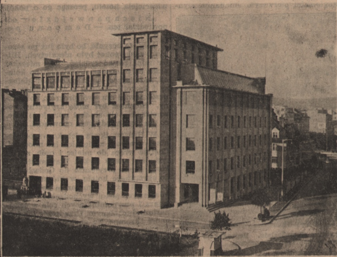
Nowowzbudowany gmach giełdy bawełnianej w Gdyni przy ul. Derdowskiego.

stwarza zatem dogodny warunki dla rozwoju nie tylko bezpośredniego importu, ale i dla handlu tranzytowego bawełną. Jak wiadomo bowiem Gdynia w ostatnich latach reeksportowała stosunkowo znaczne ilości bawełny do krajów bałtyckich i środkowej Europy. Zagadnienie handlu tranzytowego