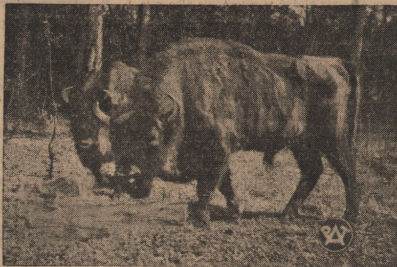
Dwa okazałe żubry z rezerwatu w Książu.

Śniadania „Cristal” Toruń Sw. Katarzyny 7, tel. 12-17 Obiady z 8 d. 1 zł - kolacje od 60 cz. na masło. Wielki wózek trunków.