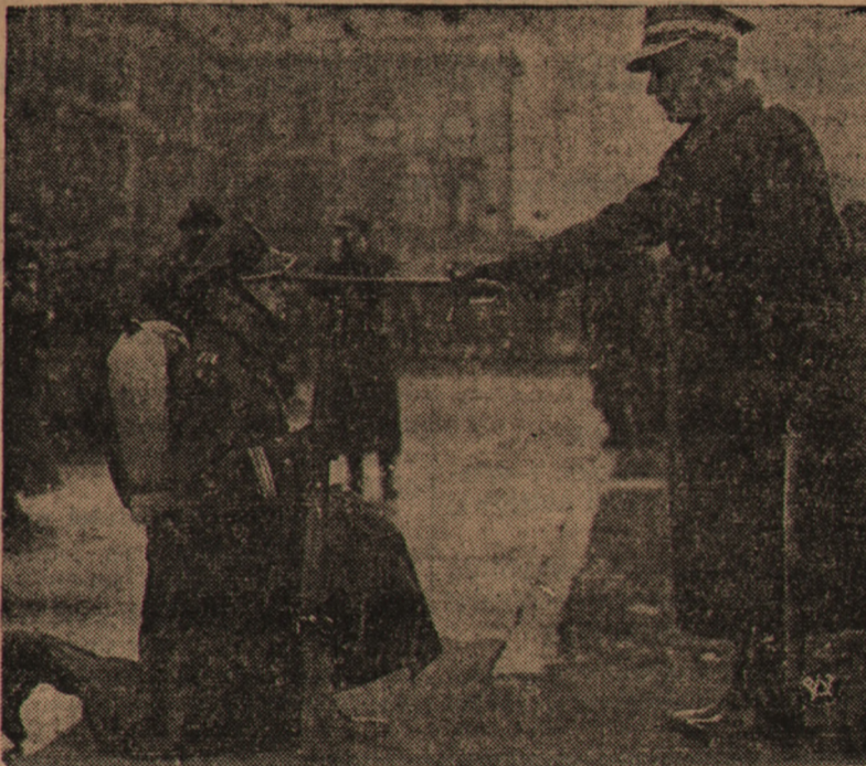
Onegdaj odbyła się uroczysta promocja absolwentów Szkoły Podchorążych Saperów. Zdjęcie nasze przedstawia moment pasowania na podporucznika prymusa Szkoły przez przedstawiciela Pana Prezydenta Rzeczypospolitej, Inspektora Armii gen. dyw. inż. Leona Berbeckiego.