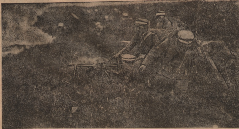
Żołnierze japońscy przy karabinie maszynowym pod Szanghajem

skiej. Dwa pociski trafiły w więźniów zabijając 10 osób i raniąc kilkadziesiąt. Więźniowie chińscy będą wydani władzom chińskim.