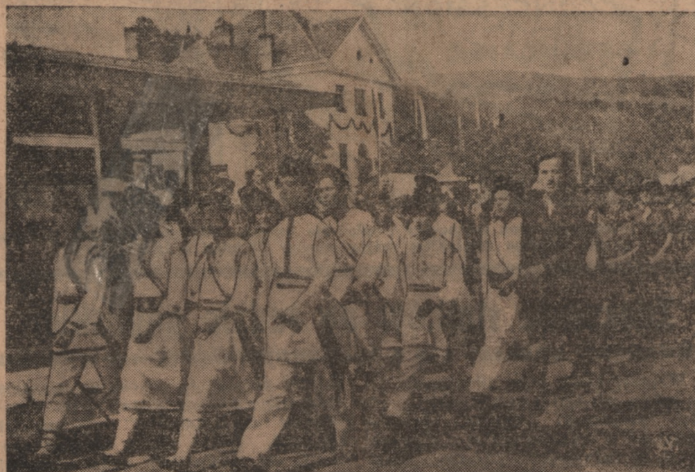
Na zdjęciu skauci rumuńscy w strojach ludowych, którzy maszerują ulicami Wisły.

Olzy aż do Czeremoszu. Defiladę grup regionalnych otworzyli mieszkańcy z Żywca w konfederatkach i złotolitych pasach, zaś mieszcanki we wspaniałych koronkowych strojach, a dalej według geograficznego po-