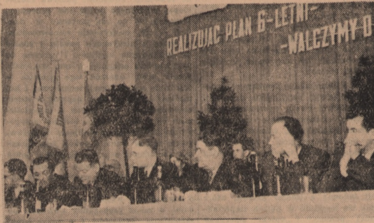
Prezydium V-go Wojewódzkiego Zjazdu Delegatów SD w czasie obrad w Bydgoszczy w Pomorskim Domu Sztuki.