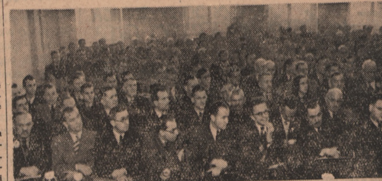
Ogólny widok na salę Zjazdu Stronnictwa Demokratycznego.

Przewodniczącym Zjazdu wybrano Jednocześnie Przewodniczącym Miejskiego