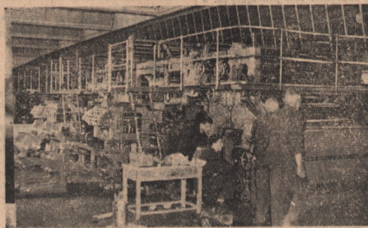
W dniu Święta Odrodzenia Prezydent RP — Bolesław Bierut dokonał uroczystego uruchomienia największej w Polsce, 96-stronicowej maszyny rotacyjnej, zmontowanej w Domu Słowa Polskiego w Warszawie. — Na zdjęciu: ogólny widok maszyny w czasie prób.