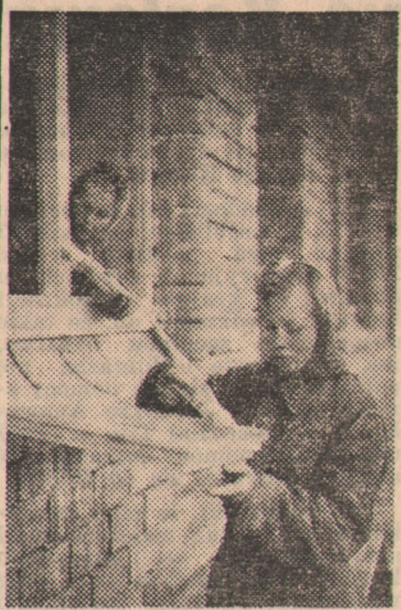
Siostry Kręzlewskie obrały sobie zawód malarek. Ramy okienne pomalowane przez nie nie wyglądają...