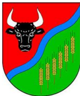
Herb Powiatu Grudziądzkiego.