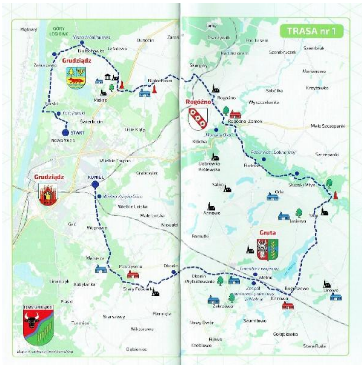
Powiat Grudziądzki mapa tras rowerowych.