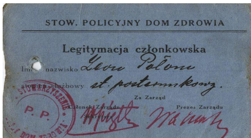
Policyjne dokumenty życia społecznego. Zbiory rodzinne.