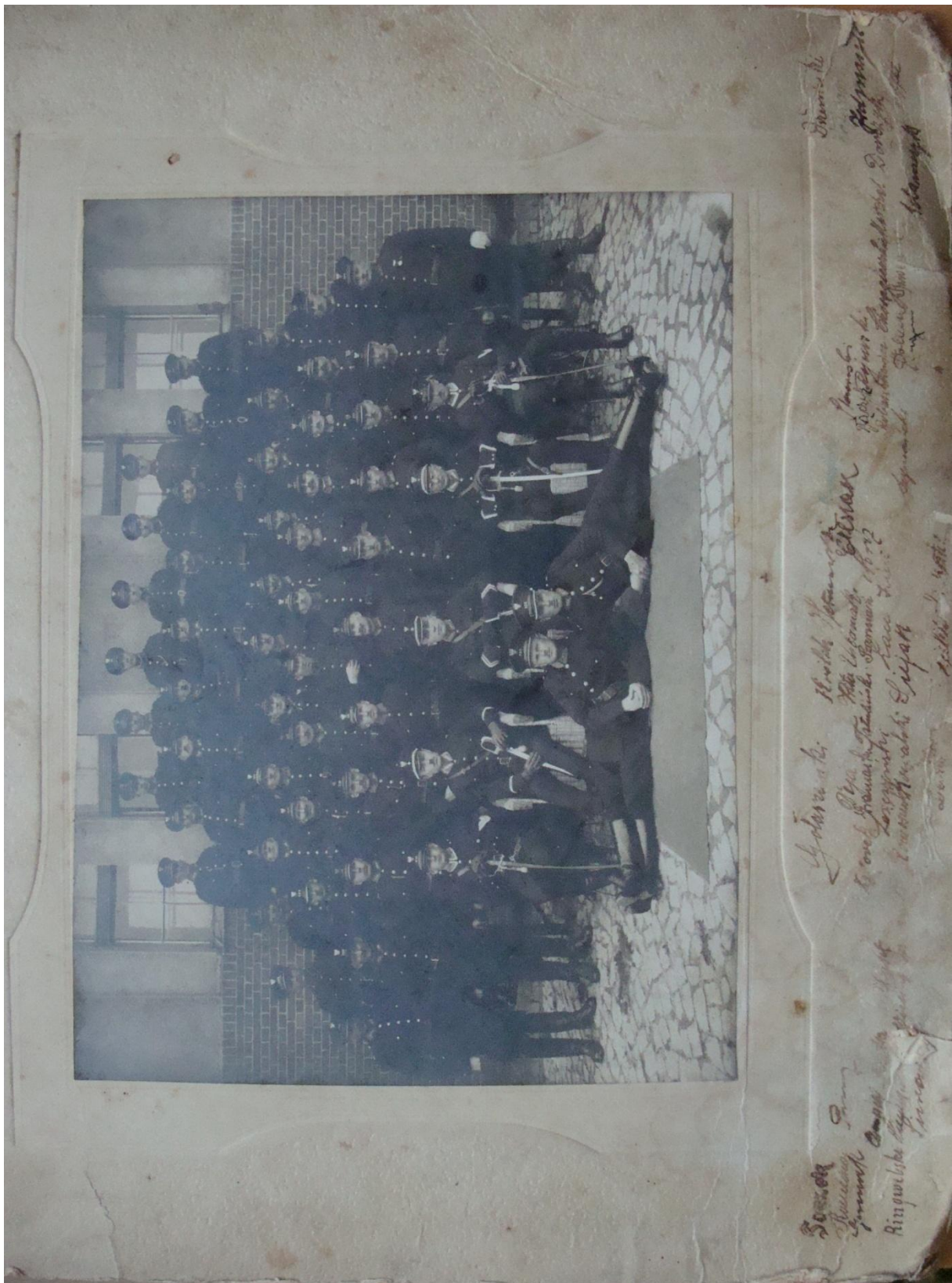
2. Okręgowa Szkoła Policyjna w Grudziądzu.