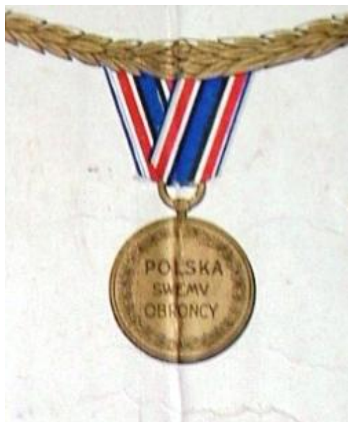
Okienko. Medal Polska Swemu Obroncy. Kadr z dyplomu.