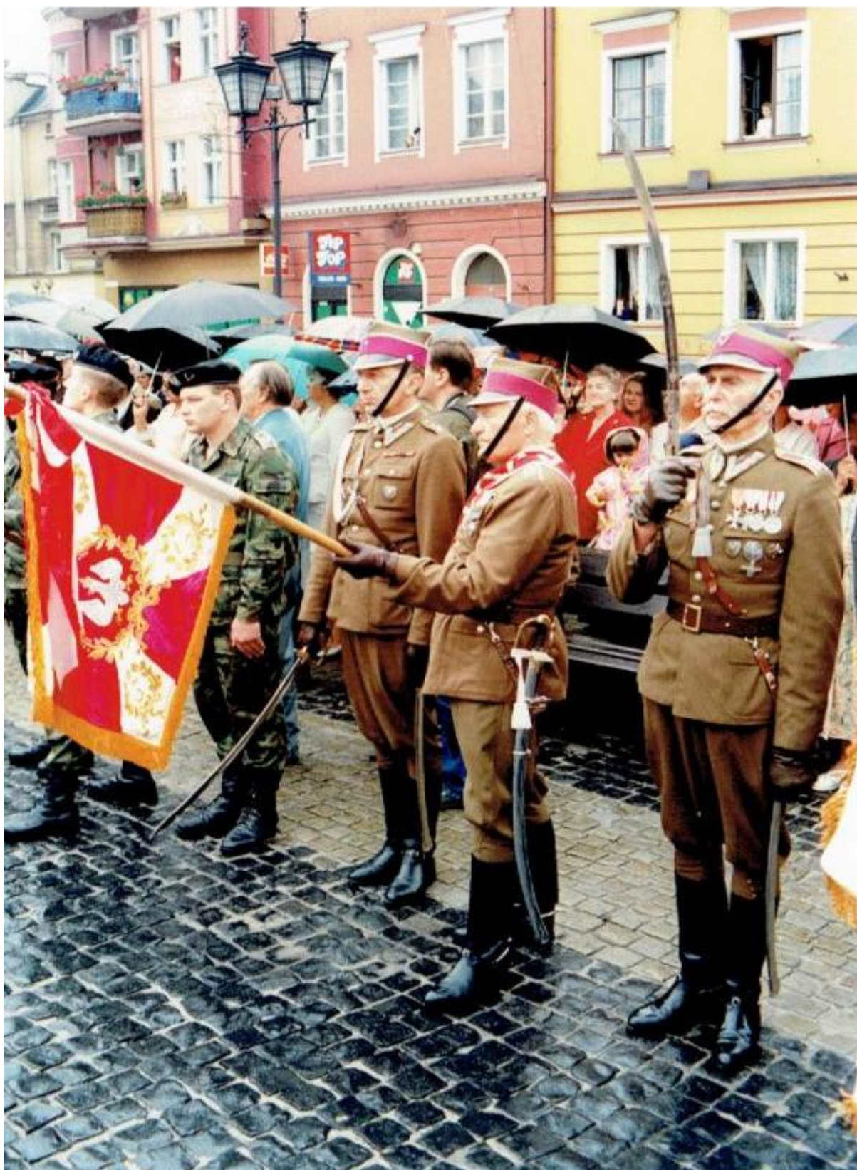
Uroczystości pod pomnikiem Żołnierza Polskiego na grudziądzkim Rynku. Sztandar 3 psk.

Bezpośrednio po Mszy św. pomaszerowano na Rynek, gdzie pod pomnikiem Żołnierza Polskiego (Niepodległości) miała miejsce oficjalna uroczystość okolicznościowa grudziądzkiego garnizonu. Obejmowała przemówienia, salwę honorową