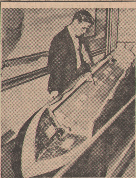
atomowej w Waszyngtonie wystawiony został nawet taki eksponat — przekrój radzieckiej bomby atomowej (na zdjęciu). Oczywiście są to tylko domysły.

Chmurno z rozpogodzeniami z możliwością niewielkich opadów. Rankiem lokalne mgły na pół-wschodzie. Temperatura od 15 do 22 st. Umiarkowane, na Wybrzeżu dość silne i porywiste wiatry z kierunków południowych i południowo-zachodnich.