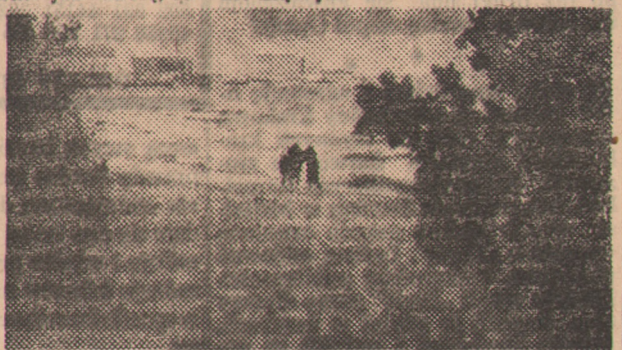
Jesień nad Bałtykiem

Na innych odcinkach codziennego życia i pracy zachodzą odwrotne procesy. Nie ma tu ani nudy, ani ziewania, ani beczynności, ani likwidacji. Jest wielki rozmach w szybkościowym budownictwie na Wybrzeżu i wspaniały zryw współzawodnictwa we wszystkich dziedzinach gospodarki morskiej.