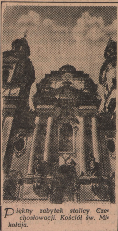
Diękny zabytek stolicy Czechosłowacji. Kościół św. Mikolaja.