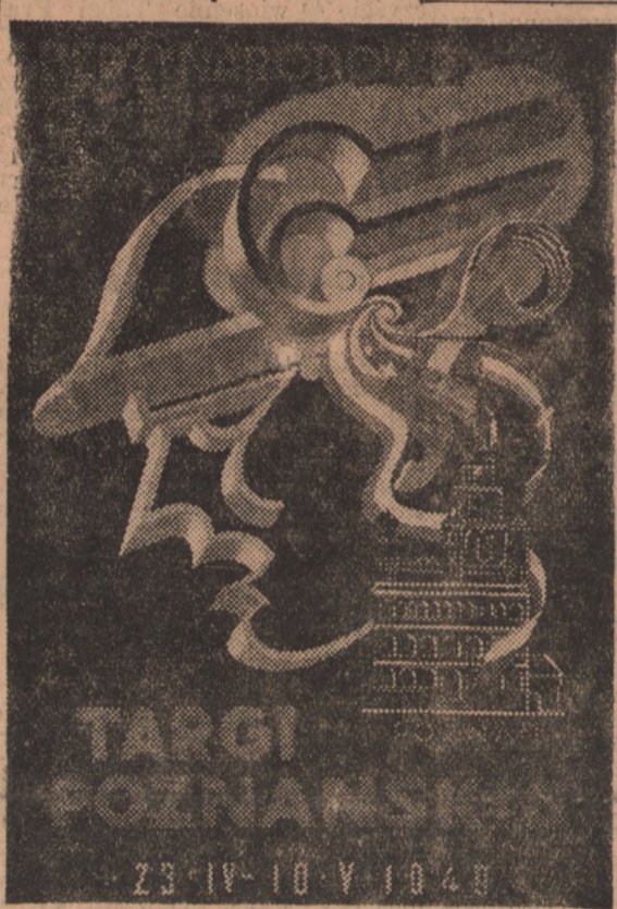
Atłas propagandowy XXII Międzynarodowych Targów Poznańskich.

Nadszedł już czas, by naród amerykański zajął od swego rządu położenie kresu prowadzonej obecnie polityce zagranicznej, wiodącej jedynie do coraz większych strat, a nie zabezpieczającej pokoju. Żądanie to jest tym bardziej konieczne obecnie, gdy rząd usiłuje zmusić amerykańskich podatników do opłacania programu, przekształcającego Europę w uzbrojony obóz i wykorzystuje przy tym te same argumenty, którymi posługiwał się, gdy chodziło o okazanie pomocy Grecji i Turcji. (PAP)