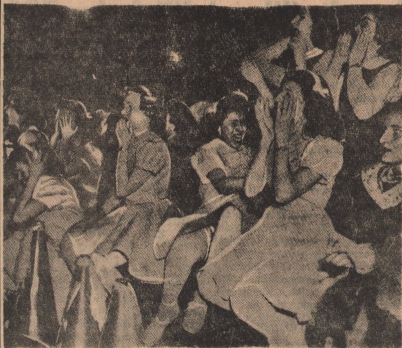
Pomyślałbyś Czytelniku, że te dziewczyny są świadkiem jakiegoś mroźnego krew w żyłach wydarzenia. Wcale nie! Tak zachowują się studentki filadelfijskiego uniwersytetu w USA na meczu basketbala w chwili, gdy pada decydująca o wyniku bramka.