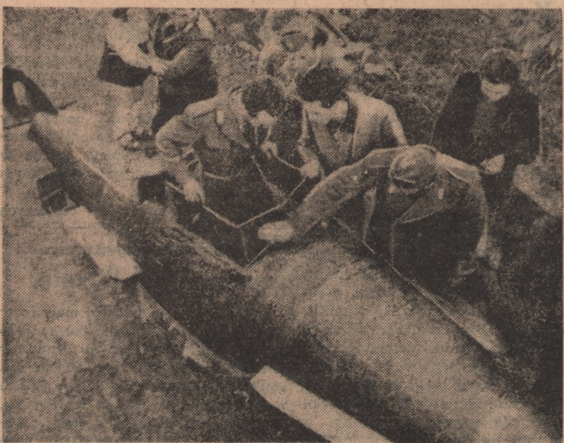
Donosiliśmy niedawno, że policja szwajcarska przytrzymała dwóch przemytników włoskich, którzy zbudowali sobie „kieszonkową” łódź podwodną o napędzie nożnym, i przy jej pomocy przewieźli towary poprzez jezioro Lugano z Włoch do Szwajcarii. Na zdjęciu widoczna jest wspomniana łódź. Zabierała ona ładunek 450 kg.