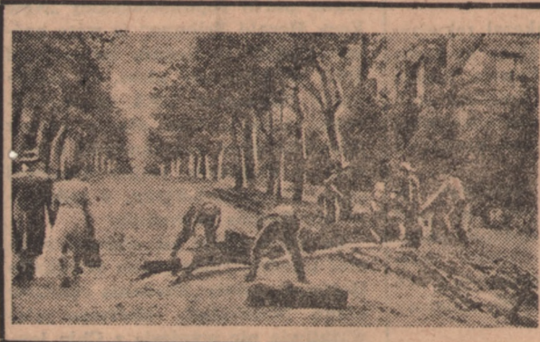
Wycinanie drzew na ulicach sektora zachodniego w Berlinie. Całe piękne aleje berlińskie przeznaczone bowiem zostały przez anglosaskie władze okupacyjne na opał. (Patrz artykuł na stronie 3).

Być może, że te żądania niemieckie nie idą po linii zamysłów Anglosasów. Jeżeli tak, to byłby to jeszcze jeden dowód, że w ognisku, które Anglosasi usiłowali dziś rozpalic, mogą sobie sami dotkliwie palce poparzyć.