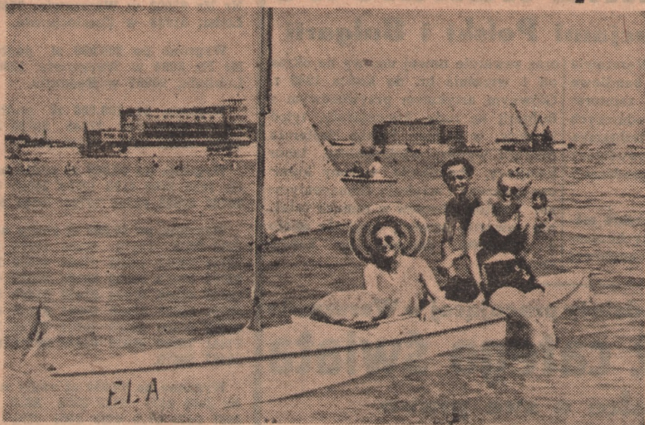
niem: bez troski roześmiane twarze „powyższych” szczęśliwców, na wodach gdańskich. (W głębi — po lewej — widoczna łuszcarnia ryżu).

W piękne, upalne dni, kiedy w rozgrzanych murach naszych miast i miasteczek nie ma po prostu czym oddychać, jakże chętnie nie wybiegamy myślą nad morze i zazdrościmy wszystkim tym, którym los umożliwił spędzenie urlopu na Wybrzeżu. Jakże przyjemnie móc się nie tylko wykapać w chłodnych falach, ale jeszcze w dodatku użyć przejażdżki na kajaku. Dowodem i potwierdzeniem