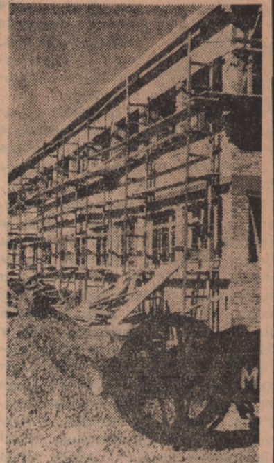
Prace przy budowie pawilonu przemysłowego.