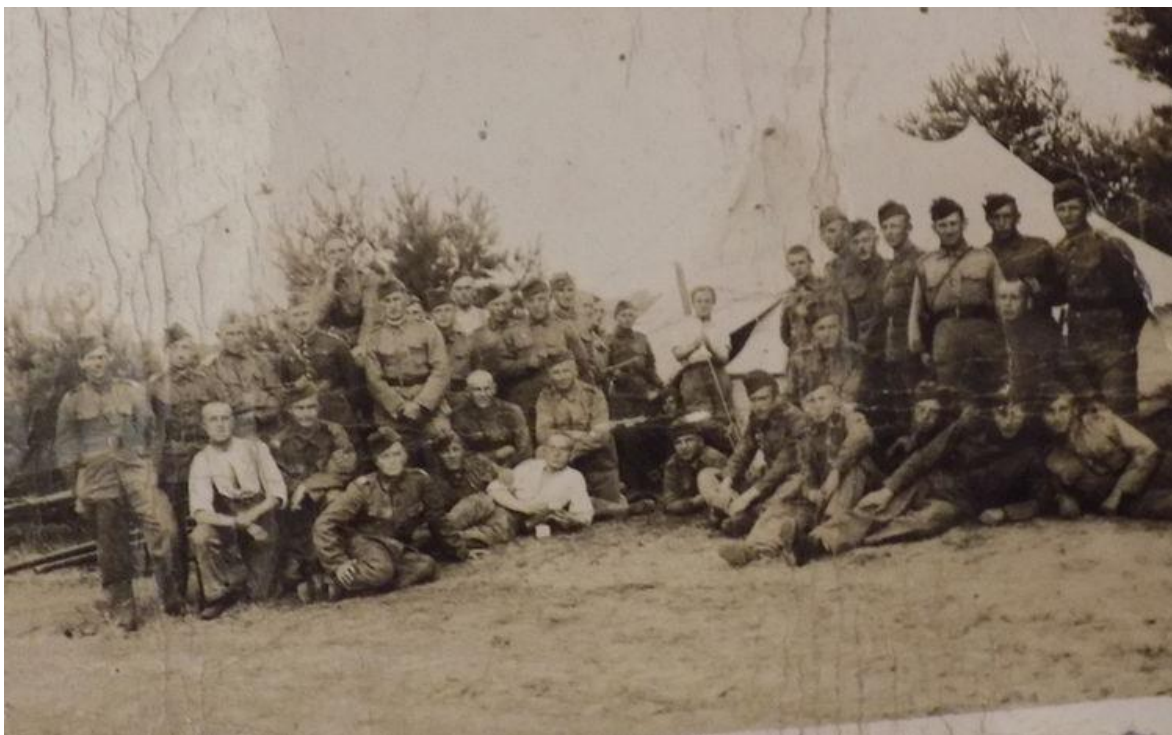
Fot. wykonana gdzieś na froncie.