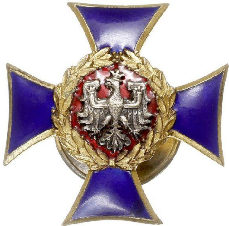
Odznaka 65. pp

Pułk chociaż nosił nazwę „Starogardzki” stacjonował w Grudziądzu (z wyjątkiem II batalionu, który był w Gniewie) można nazwać go więc także „grudziądzkim” z ulicy Fijewskiej. Dlatego też warto przypomnieć drukiem i ocalić od zapomnienia przebieg