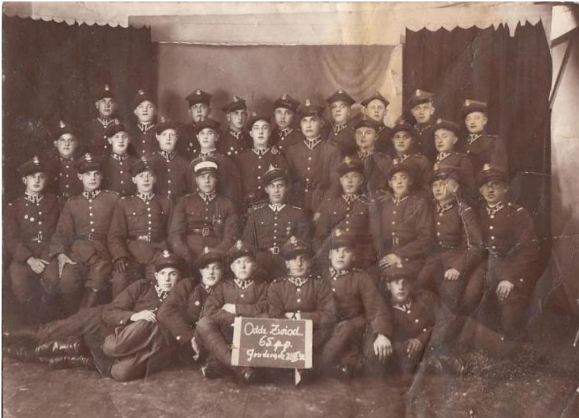
Oddział zwiadowczy 65. pp.

Pozycja obronna na linii Lisewo – Strucfoń, jako bezp. skrzydła 4 DP. Słaba styczność z nplem. Naloty małych związków lotn. npla na maszerujące oddziały i rejon Lisewa.