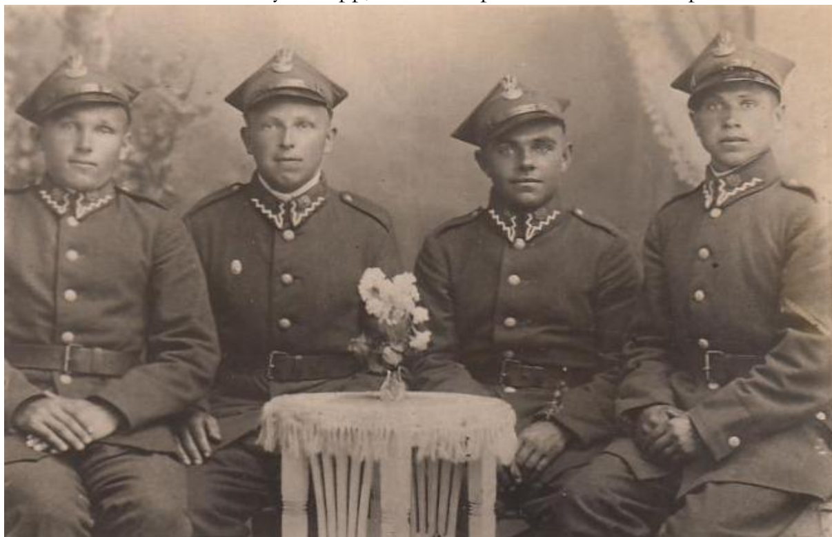
Żołnierze 65. pp

nak bez powodzenia i baon odchodzi na 91-Pokrzywno, gdzie trzyma się do godz. 14.00. Tu ma rozkaz d-cy 65. pp, wchodzi ponownie w skład pułku i razem