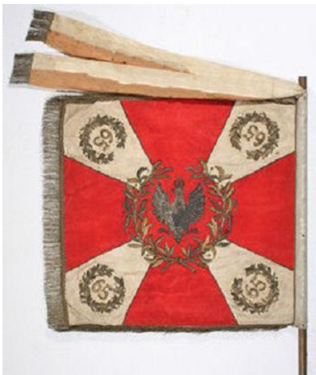
Sztandar 65. pp

Odparcie natarcia npla na Grabowiec – Stanisławowo. Na wskutek flankowego uderzenia npla z kierunku 88 – Grabowiec, III/65 ponosi duże straty. II/65+dyon a. l. mjra Gaja o godz. 17.45 uderzają na Nicwałd i cieśniny jez. Annowo, zdobywając je i walczy w ciągu nocy ze zmot. jedn. npla w rej. Annowo – Nicwałd, bierze jeńców, zdobywa sprzęt.