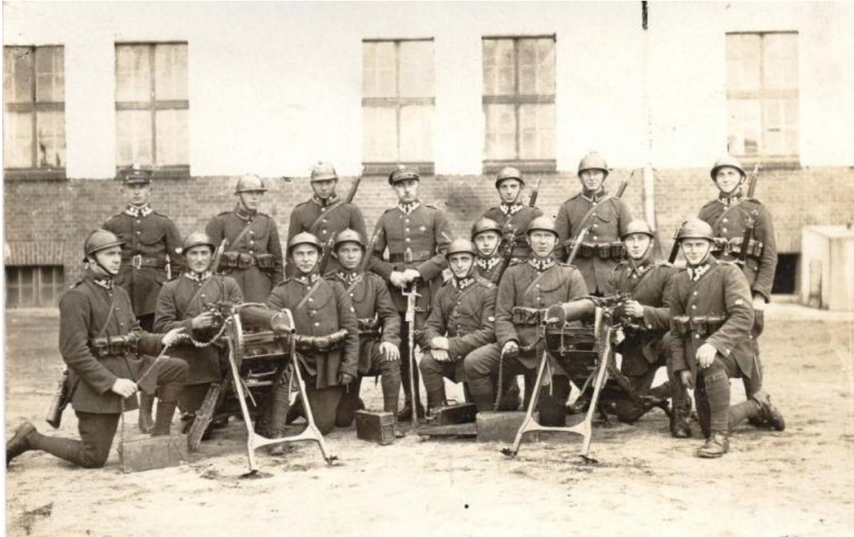
65 Starogardzki Pułk Piechoty

Mobilizacja I i III batalionu w Grudziądzu, zajęcie umocnionych stanowisk obronnych: Księża Góry, na linii rzeki Osy, na odcinku Parsk – Grabowiec wł. II/65pp-mob. w Gniewie – od 26 VIII wchodzi w skład OW Wisła.