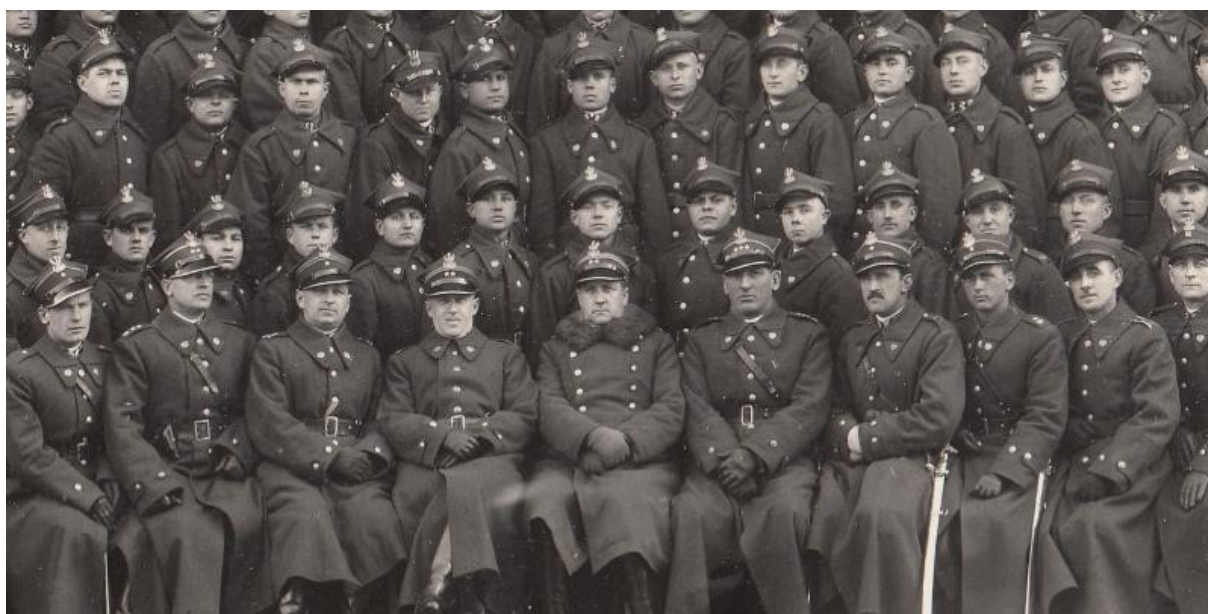
Fragment fotografii powyżej.